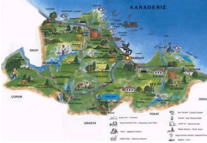
Şekil 1. Samsun Haritası