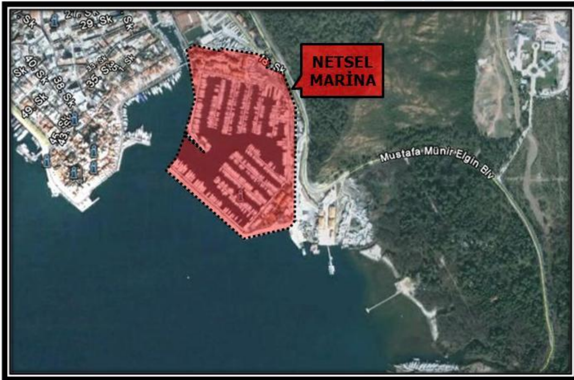
(EK: 1: Gayrimenkule Ait Fotoğraflar)

Netsel Marina, 2005 yılından itibaren, Setur Marinaları ve Torunlar Şirketler Grubu ortaklığı kontrolünde olup, üzerinde konumlandırıldığı parseller 05.05.1989 tarihinden itibaren 49 (22.12.2037 tarihine kadar) yıllığına Kültür ve Turizm Bakanlığı'ndan kiralanmıştır.