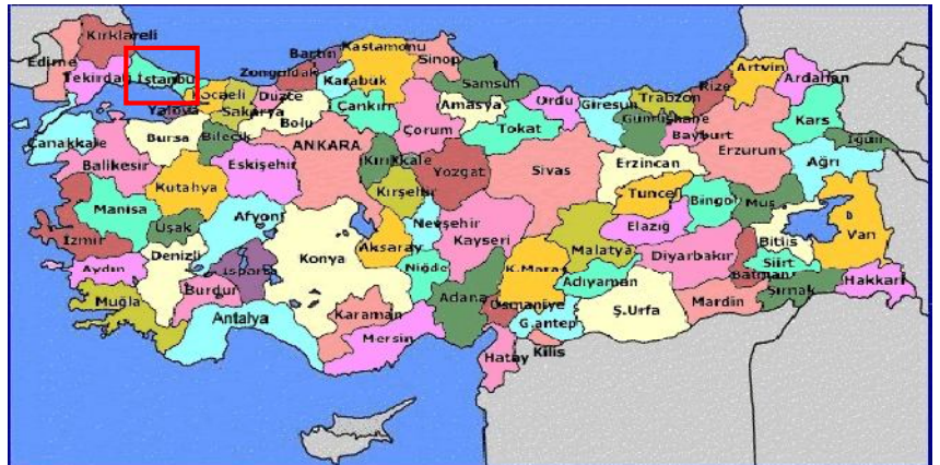
Harita 1 - İstanbul'un Konumu

İstanbul, Türkiye'nin en büyük kenti olup, yıllık %0 33.1 nüfus artışı ve 10 milyon kişiyi aşan nüfusu ile dünyanın da sayılı kentlerinden biri haline gelmiştir. Batı ile Doğu arasında köprü olma özelliği ile yerli ve yabancı sermaye için, bölgelerarası ilişki kurma ve bölgelere açılma yönünden önemli bir merkezdir. İstanbul Boğazı, Karadeniz'i, Marmara Denizi'yle birleştirirken; Asya Kıtası'yla Avrupa Kıtası'nı birbirinden ayırmakta ve İstanbul kentini de ikiye bölmektedir.