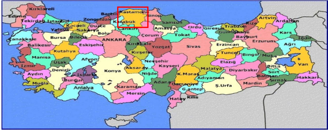
Harita 1 - Kastamonu'nun Konumu

2011 Adrese Dayalı Nüfus Sayımına göre nüfusu 359.759 olarak tespit edilmiştir. Kastamonu ilinin; Merkez, Abana, Araç, Bozkurt, Ağlı, Azdavay, Cide, Çatalzeytin, Devrekani, Daday, Doğanyurt, Hanönü, Hanönü, İhsangazi, İnebolu, Tosya, Küre, Taşköprü, Seydiler, Pınarbaşı ve Şenpazar olmak üzere toplam 20 ilçesi vardır.