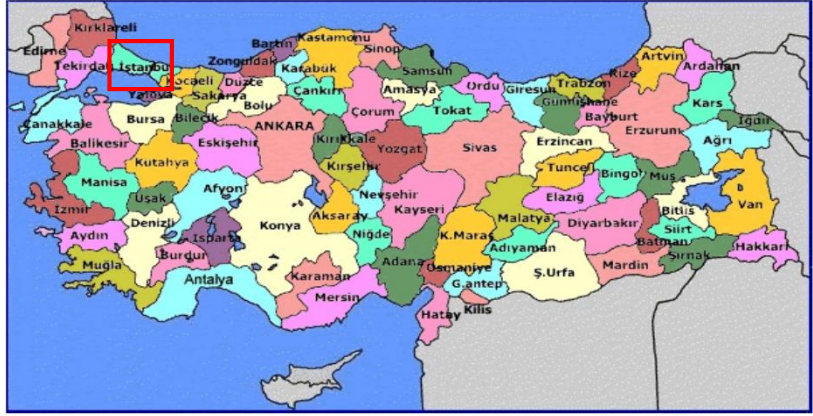
Harita 1 - İstanbul'un Konumu

İstanbul, Türkiye'nin en büyük kenti olup, 13 milyon kişiyi aşan nüfusu ile dünyanın da sayılı kentlerinden biri haline gelmiştir. Batı ile Doğu arasında köprü olma özelliği ile yerli ve yabancı sermaye için, bölgelerarası ilişki kurma ve bölgelere açılma yönünden önemli bir merkezdir. İstanbul Boğazı, Karadeniz'i, Marmara Denizi'yle birleştirirken; Asya Kıtası'yla Avrupa Kıtası'nı birbirinden ayırmakta ve İstanbul kentini de ikiye bölmektedir.