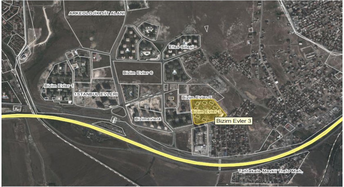
KROKİ-4-TAŞINMAZIN BULUNDUĞU SİTE VE DİĞER SİTELER İÇİNDEKİ KONUMU