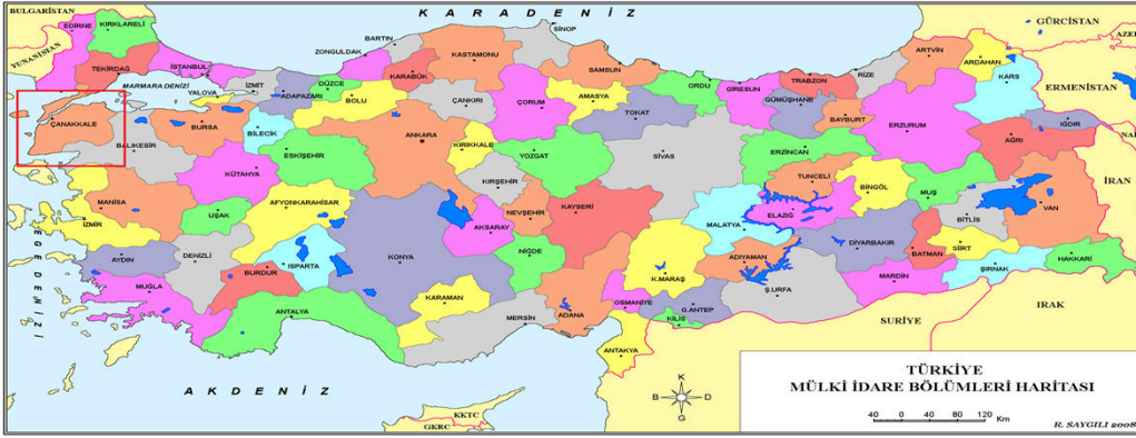
Harita 1 - Çanakkale'nin Konumu