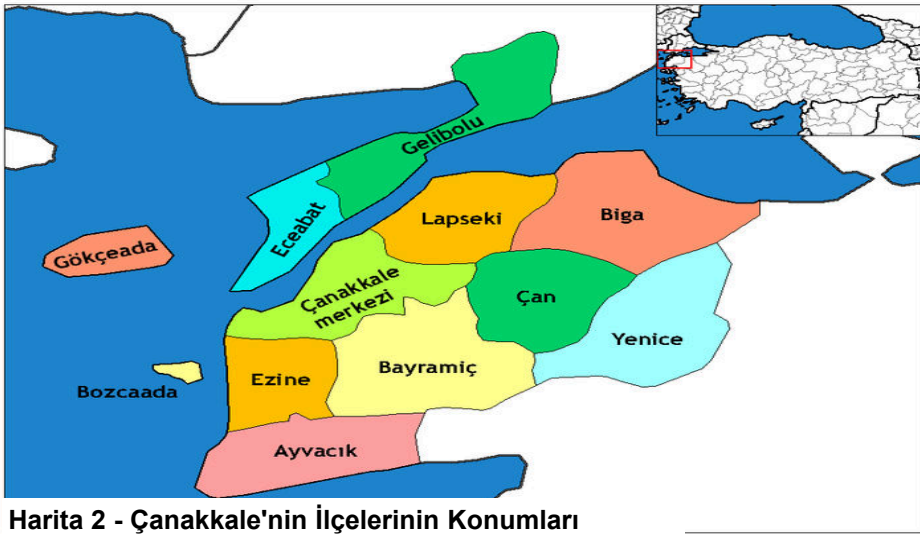
Harita 2 - Çanakkale'nin İlçelerinin Konumları

Çanakkale ilinin ekonomisi tarıma dayanır. Sanâyi yeni yeni gelişmektedir. Turizm, balıkçılık ve ormancılığın ekonomideki yeri giderek artmaktadır. İmâlat sanâyi gelişmektedir. Balık, üzüm ve seramik meşhurdur.