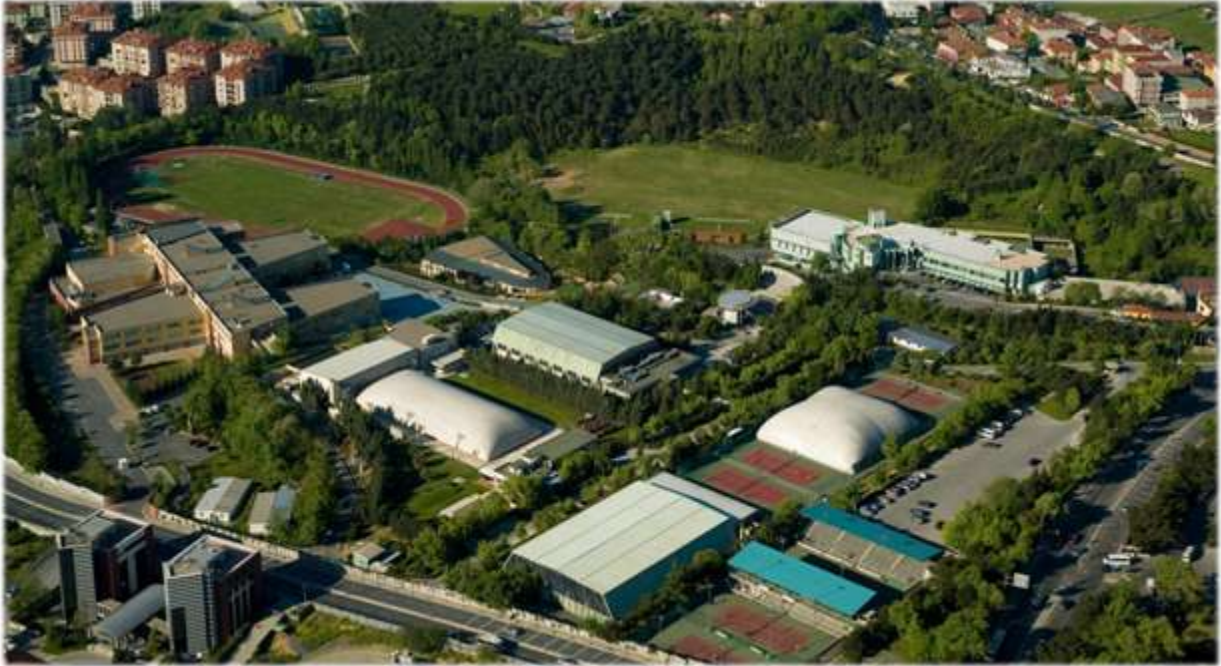
Sadi Gülçelik Spor Sitesi - İstanbul

Enka Spor Kulübü, 2012 yılı itibarıyla faaliyet göstermekte olduğu spor branşlarında 902 lisanslı sporcu ve branşlarında uzman 64 antrenörü ile Enka tesislerinde ulusal ve uluslararası müsabakalara hazırlanmakta ve bu müsabakalarda yer almaktadırlar. Atletizmde 335, yüzmede 279, teniste 148, sutopunda 66, voleybolda 30, basketbolda 14, kayakta 21 ve triatlonda 9 aktif lisanslı sporcu ile hedefe odaklanmış olarak, her sezon yeni başarılar elde etmektedir.