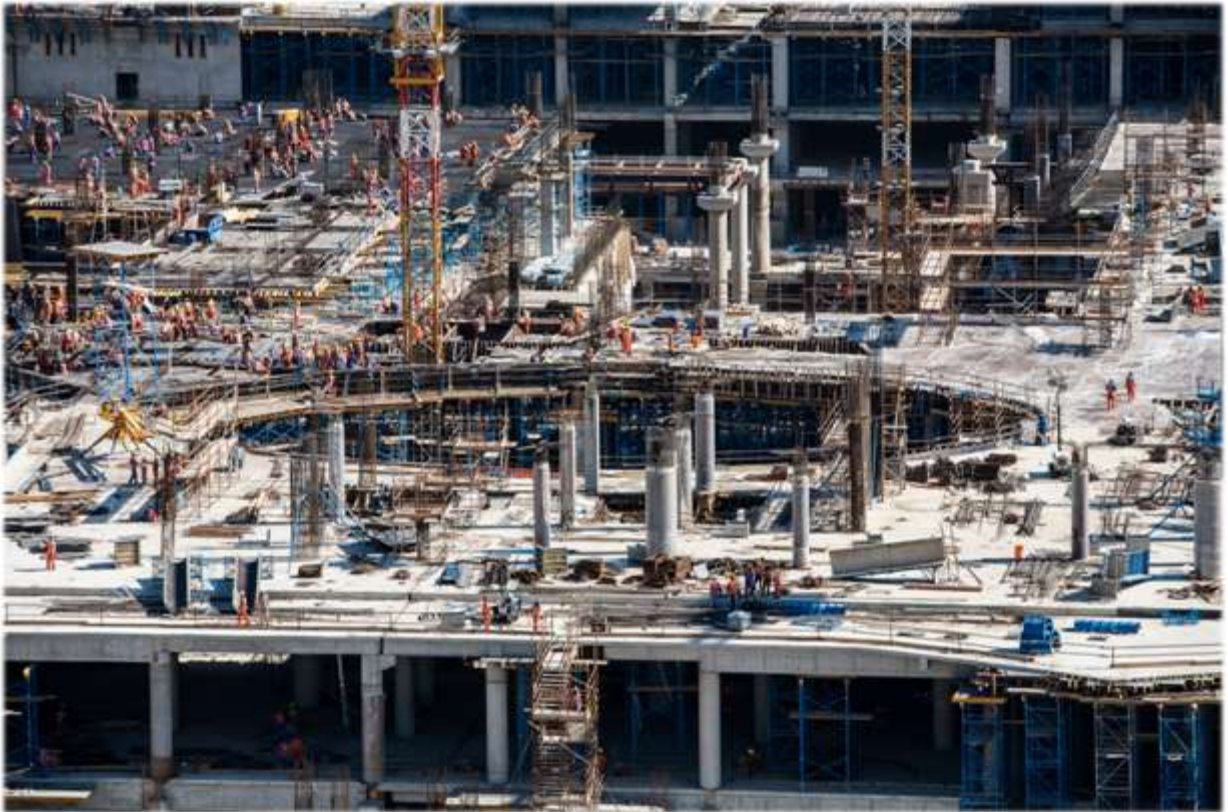
Maskat Uluslararası Havaalanı - Umman Sultanlığı

Maskat Uluslararası Havaalanı Geliştirme Projesi Umman Sultanlığı'ndaki en büyük inşaat projesidir. Geliştirme çalışmaları Ana Kontratlar ve Standart Ulusal Kontratlar olmak üzere 11 bölüme ayrılmıştır. Ana Kontrat 3 (MC3), Yolcu Terminal Binası Tasarım Geliştirme ve İnşaatı, geliştirme projesinin en geniş kapsamını oluşturmaktadır. Proje tamamlandığında Maskat Uluslararası Havaalanı yılda 12 milyon yolcu kapasitesine ulaşacak, sonrasında yapılacak ilavelerle yılda 24 ila 36 milyon yolcuya kadar genişletilebilecektir.