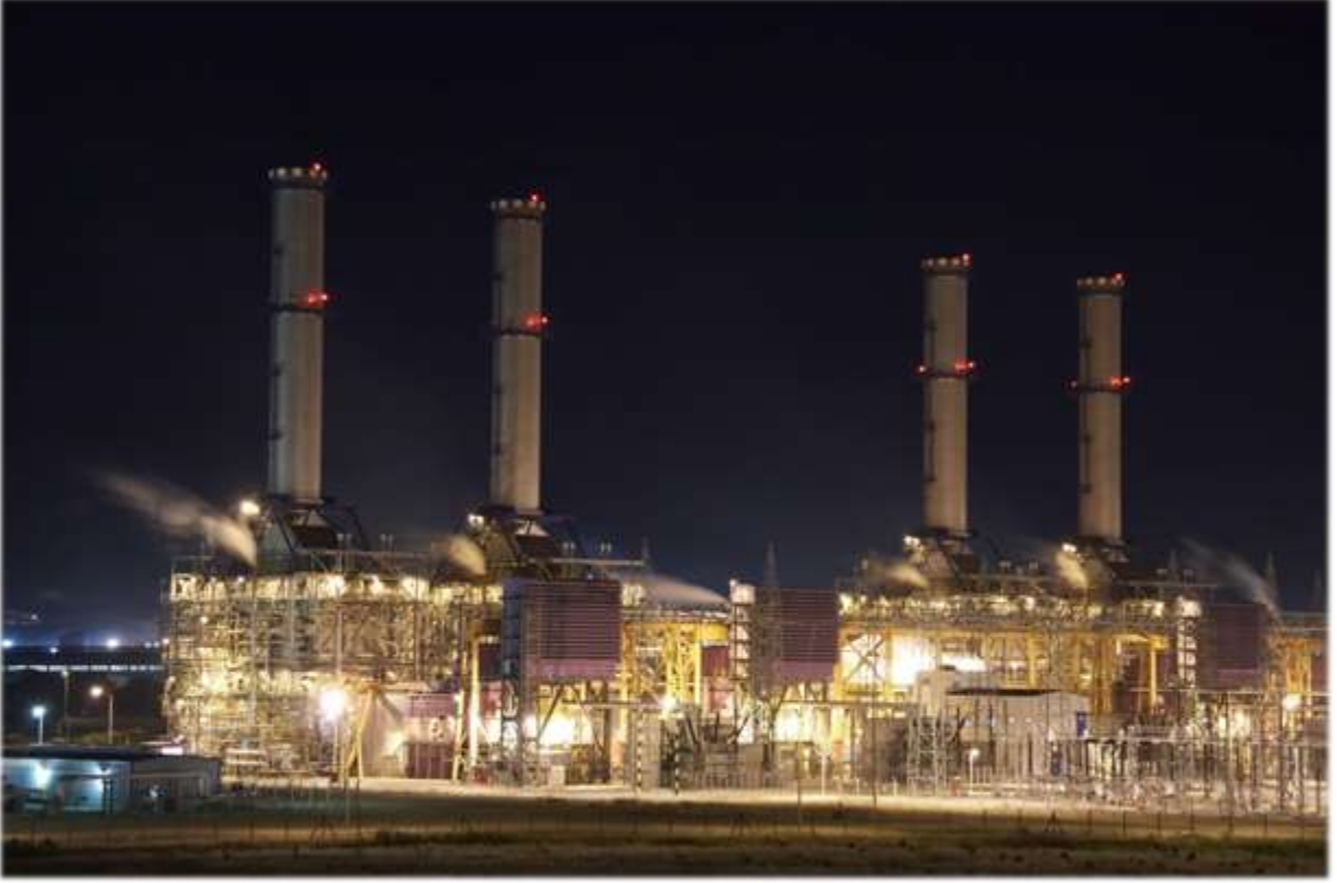
Izmir Doğalgaz Kombine Çevrim Santrali - Türkiye