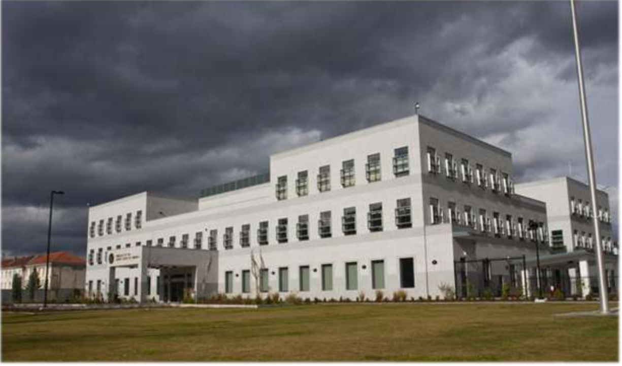
ABD Elçilik Binası – Saraybosna, Bosna-Hersek