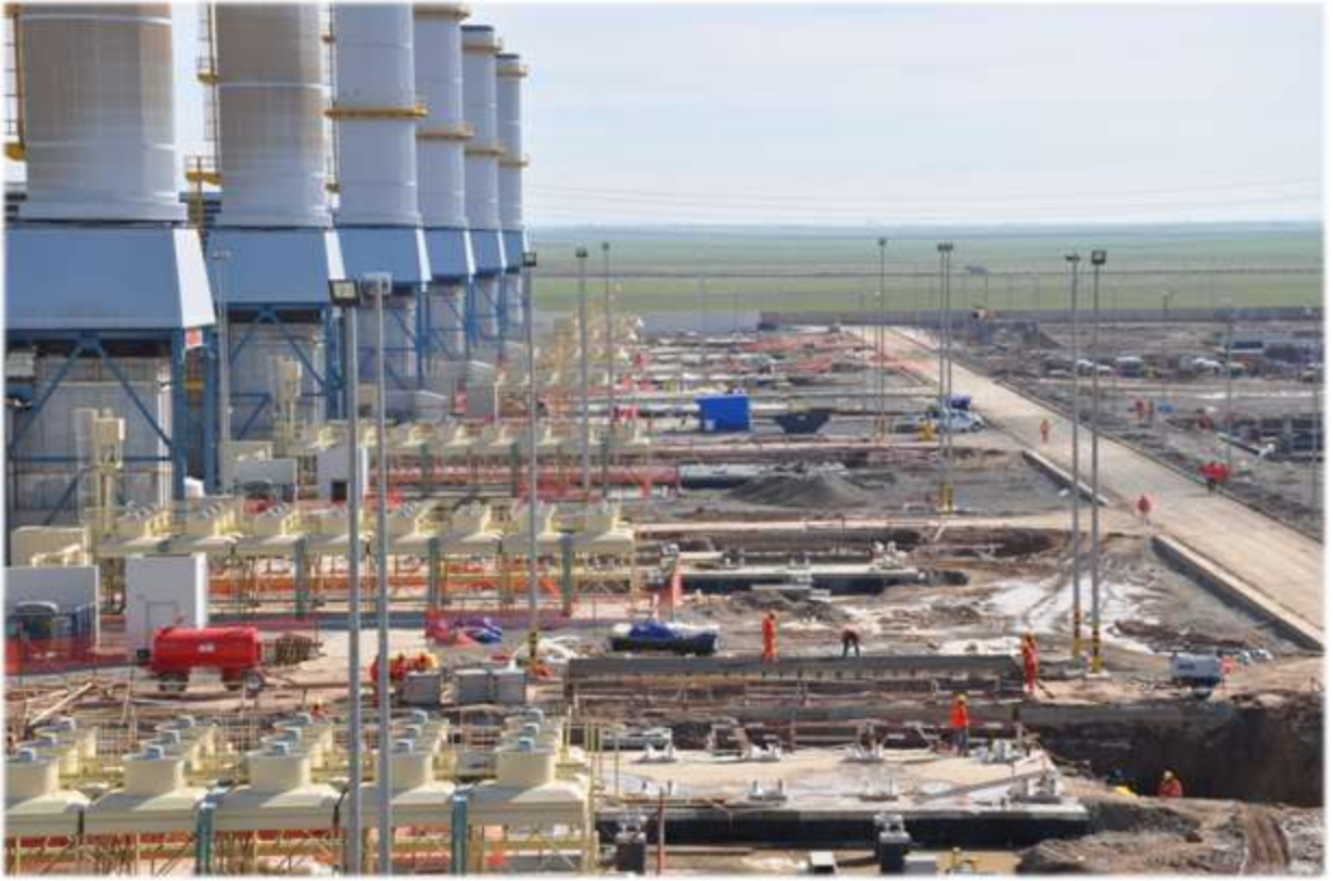
Kombine Çevrim Santralı Projesi – Erbil, Irak

Kontrat kapsamında yer alan ana işler, sekiz adet atık ısı kazanı (HRSG), iki adet 250 MW gücünde buhar türbini (STG), iki adet jeneratör step-up trafosu (GSU), 400 kV'luk şalt sahası ve soğutma sistemidir. Kapsamda ayrıca basit çevrim enerji santralini 4x4x1 şeklinde iki bloktan oluşacak kombine çevrim santralına dönüştürülmesi projesi için gerekli olacak diğer tamamlayıcı ekipmanlara ilişkin inşaat ve montaj işleri de dahil olmak üzere projelendirme, satınalma, montaj ve işletmeye alma işlerinin bütünü yer almaktadır.