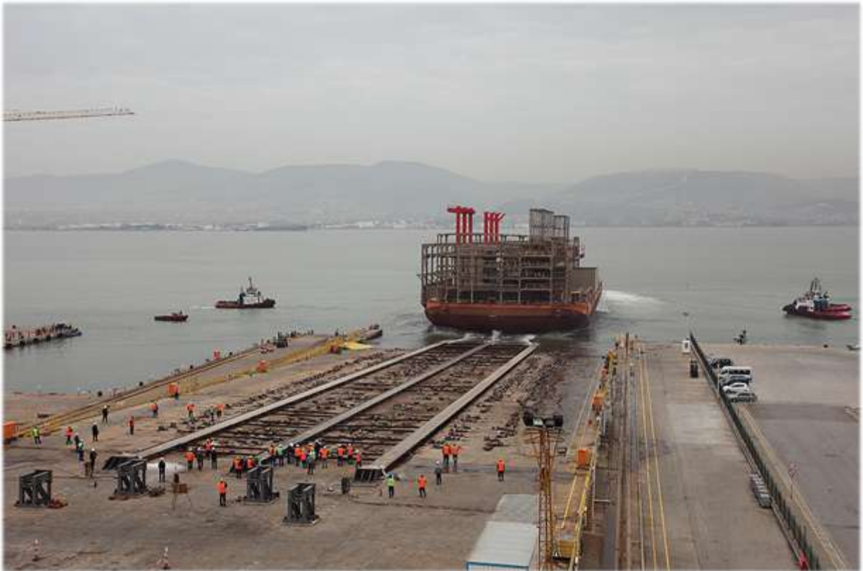
"Mavna - Denize İniş Operasyonu" Çimtaş Gemi İnşa Sanayi ve Ticaret A.Ş., Kocaeli Tersanesi - Türkiye

Çimtaş Gemi, 2012 yılında 136 metre boy, 42 metre en ve 8.200 ton çelik ağırlığı olan bir mavnanın kombine çevrim yüzer enerji santralına dönüşüm projesi çerçevesinde, Türkiye'de bugüne kadar gerçekleştirilmiş en yüksek tonajlı denize iniş operasyonunu başarı ile tamamlamıştır.