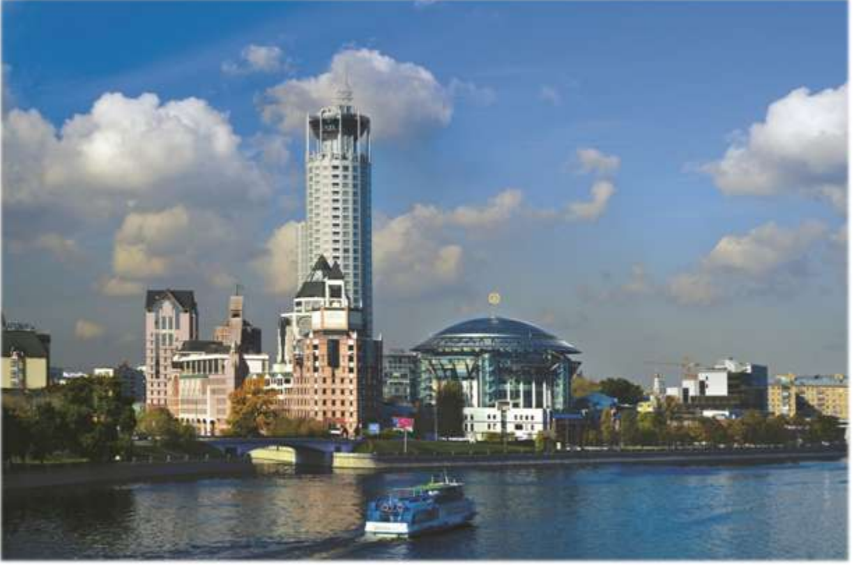
Riverside Towers, Moskova - Rusya

JSC Moskva Krasnye Holmy, otel ile birlikte 13'ü Türk, toplam 429 eleman çalıştırmakta olup ayrıca kendisine iş yapan taşeronları da yaklaşık 150 kadar eleman kullanmaktadır. Şirketin 2012 yılı cirosu 84,7 milyon ABD Doları olarak gerçekleşmiştir.