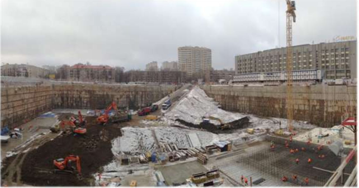
Kuntsevo Projesi diyafram duvar ve SBMA ankraj imalatı, Moskova - Rusya