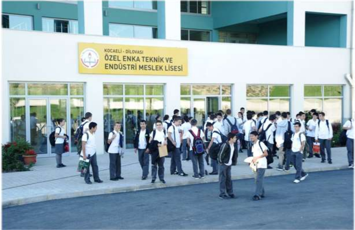
Özel Enka Teknik ve Endüstri Meslek Lisesi - Kocaeli

Vizyonumuz; okulumuzda "Enka" ismine yakışır biçimde vereceğimiz eğitimle, kendi alanında Türkiye’de bir ilki gerçekleştirip yüklediğimiz sorumluluğun farkında olarak, bizden sonraki kurumlara iyi bir örnek teşkil etmek, onlardan alacağımız güç ve destekle avrupa ve dünyada mesleki / teknik eğitim alanında söz sahibi olmak olarak belirlenmiştir.