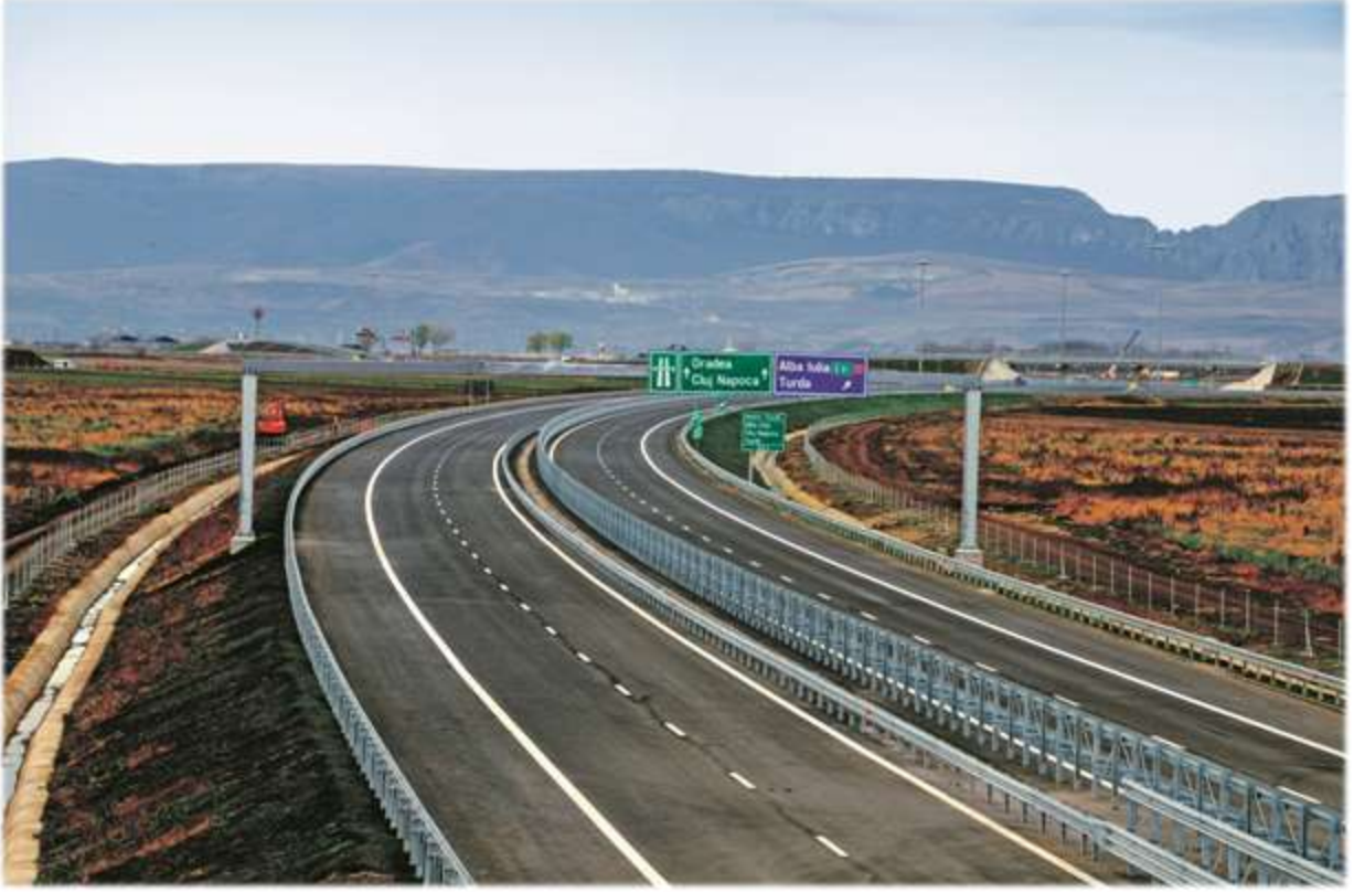
Transilvanya Otoyol Projesi - Romanya

2012 yılında Enka ve Bechtel olarak saha çalışmalarına, Bölüm 3C'de ağırlıklı olarak 42'nci ve 60'uncu kilometreler arasında, Bölüm 2b'de ise yerel yollarda devam edilmiştir. 2012 yılının son çeyreğiyle birlikte, işverenin yaşadığı proje finansıyla ilgili zorluklar sebebiyle, mevcut iş programı işverenden gelen talep doğrultusunda kısmen yavaşlatılmıştır.