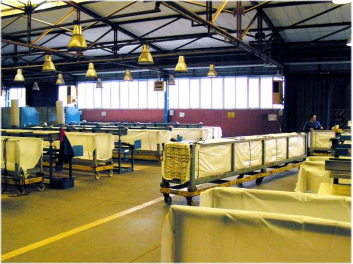
Pimaş Fabrikası, Gebze - Türkiye

Türkiye’de 1.400’ün üzerinde satış noktası ile tüm yurda yayılmış bulunan Pimapen, Pimaş Siding, Pimaş Camoda, Pimawood, DWT ve Maestro bayileri, Pimaş’ın öngördüğü şartlarda üretim ve uygulamaları ile lider konumda olmanın sorumluluğunu taşımaktadırlar.