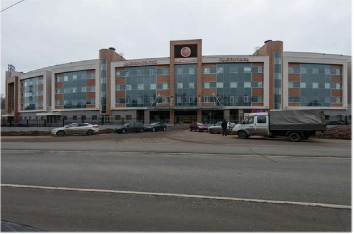
Lapino Doğum Hastanesi Projesi - Rusya

Üç ana bloktan oluşacak şekilde inşa edilen hastane, toplam 87 yataklı olmak üzere kadın doğum bölümü, büyük çocuklar için rehabilitasyon bölümünü de içeren yenidoğan merkezi, gözetim bölümü ve jinekoloji kliniğinden oluşmaktadır. Proje, çocuklar için günlük 150 hasta ziyareti ve yetişkinler için 250 hasta ziyareti planlanan tanı ve ayakta tedavi merkezi, laboratuvar, SPA merkezi, rehabilitasyon ile terapi ve kozmetik bölümü ile yüzme havuzunu da kapsamaktadır.