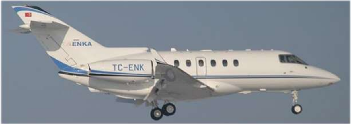
Hawker 900XP Tipi Jet Uçağı

Airenka Hava Taşımacılığı A.Ş., Sivil Havacılık Genel Müdürlüğü’nün 22 Nisan 2002 yürürlük tarihli ve 2002-HT-04 numaralı İşletme Ruhsatı ile kurulmuş ve bu tarih itibarıyla iç ve dış hatlarda hava taksi işletmeciliği yapmaya yetkili kılınmıştır.