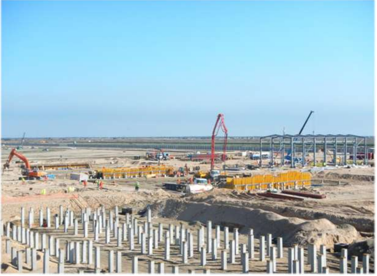
Lukoil Enerji Santrali Projesi - Basra, Irak

Mevcut kontrat kapsamındaki işlerin yapımı devam ederken, Enka ve LMEL, projenin kapasitesinin 126 MW'tan 252 MW'a arttırılması ve santralin devreye alınması hizmetlerini de kapsayan ilave işler üzerinde anlaşarak ilgili sözleşme dökümantasyonunu paraflamışlardır. Aralık 2012'de Enka, LMEL'den ilave işler için bir niyet mektubu almıştır. İlave sözleşmenin, lokal idarelerden gerekli onayların alınmasını müteakip, 2013 yılının ilk yarısında imzalanarak yürürlüğe girmesi beklenmektedir.