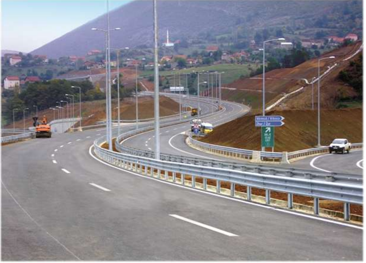
Morina-Merdare Otoyol Projesi - Kosova

Mobilizasyon dahil 18 ay gibi kısa bir sürede, otoyolun 40 kilometrelik ilk kısmı Kasım 2011'de trafiğe açılmıştır. Projenin Duhel kavşağına kadar olan 4,2 kilometrelik kısmı Temmuz 2012'de, 5'inci bölümün sonuna kadar olan 18 kilometrelik kısmı ise Kasım 2012'de trafiğe açılmıştır. Bir diğer 18 kilometrelik kısmın inşaatına ise başlanmış olup 2013'ün son çeyreğinde tamamlanması öngörülmektedir.