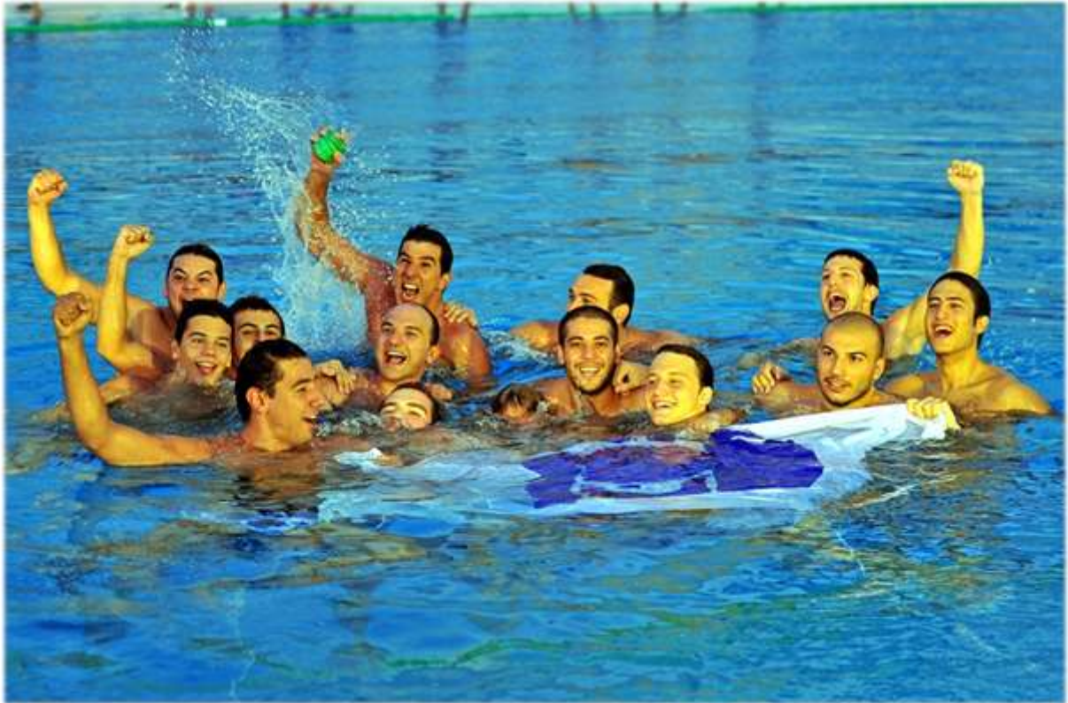
Enka Sutopu Takımı

2012 yılında, Kulübümüz Sutopu A Takımı serisini 2011-2012 sezonunu Türkiye 3'üncülüğü ile tamamlayarak ülkemizi LEN CUP'ta temsil etmeye hak kazandı. Minikler, ümitler ve küçükler liglerinde şampiyon, yıldızlarda 2'nci olurken, Gençler Ligi'nde 4'üncü sırada yer aldık.