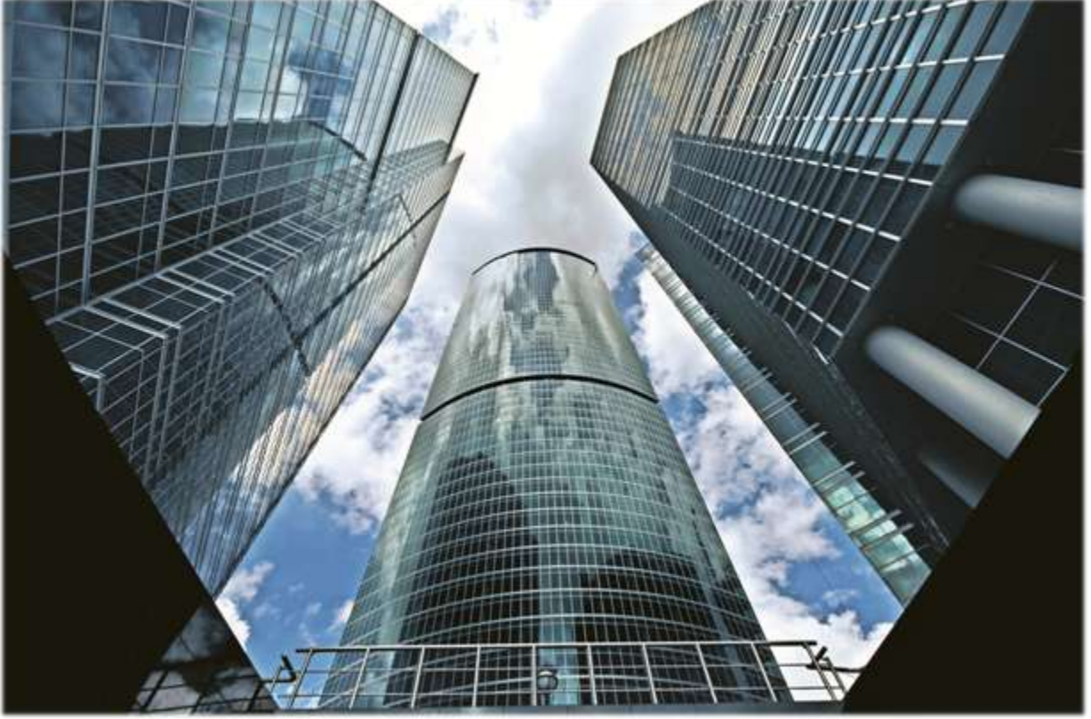
Naberezhnaya Tower, Moskova - Rusya

Enka'nın Moskova'da sahip olduğu ofis alanı, otel ve alışveriş merkezlerinden elde ettiği kira geliri 2012 yılında 442 milyon ABD Doları olarak gerçekleşmiştir. Enka, 2012 yıl sonu itibarıyla 330.000 metrekare kiralanabilir A sınıfı ofis alanına, 235 odalı otele ve Kuntsevo Alışveriş Merkezi'nin yeniden inşası nedeniyle yıkılmasının ardından 215.000 metrekare kiralanabilir perakende alanına sahiptir.