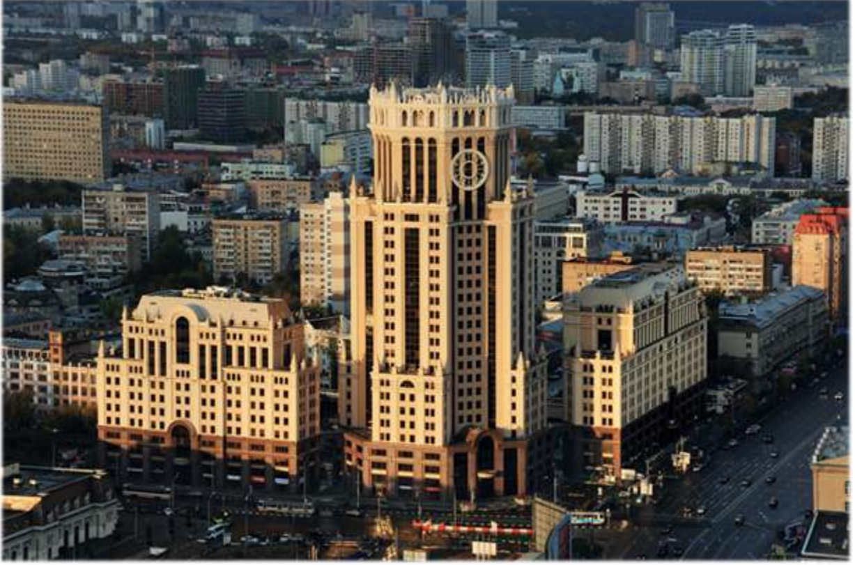
Paveletskaya İş Merkezi, Moskova - Rusya

Uluslararası kiracılarımızın bir kısmı ile 17-18 sene önce başlayan kiralama ilişkilerimiz, yaptığımız kontrat yenilemeleri ile uzatılmıştır. Enka portföyünde olan ve önümüzdeki uzun dönemlerde Enka ile birlikte olacak mevcut kiracılarımızın arasında; Statoil, HSBC, Linklaters, Linde Gas, Medtronic, Fortum, Universal Pictures, UBS, General Electric, Eli Lilly, Polycom, IBM, Chanel, La Prairie, Symantec, Tommy Hilfigher, Oracle, LG Electronics, E.On, IATA, Mitsui & Co., Citibank, Renaissance Capital, BASF, Cleary Gottlieb Steen & Hamilton, Richemont, Pfizer, National Oilwell Varco, KPMG, Les Laboratoires Servier, Accenture, BP-Castrol ve Nestle bulunmaktadır.