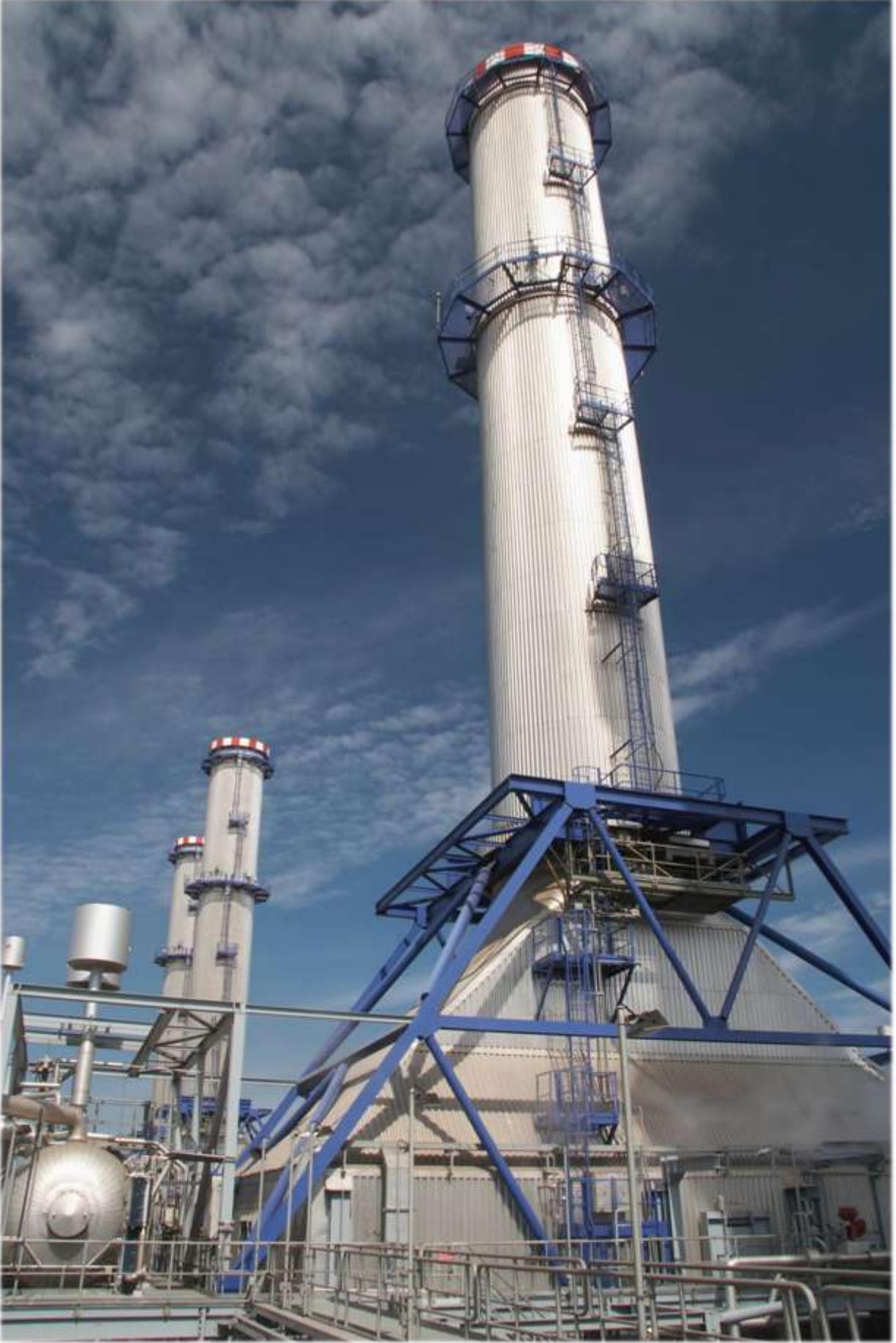
İzmir Doğalgaz Kombine Çevrim Santrali - Türkiye