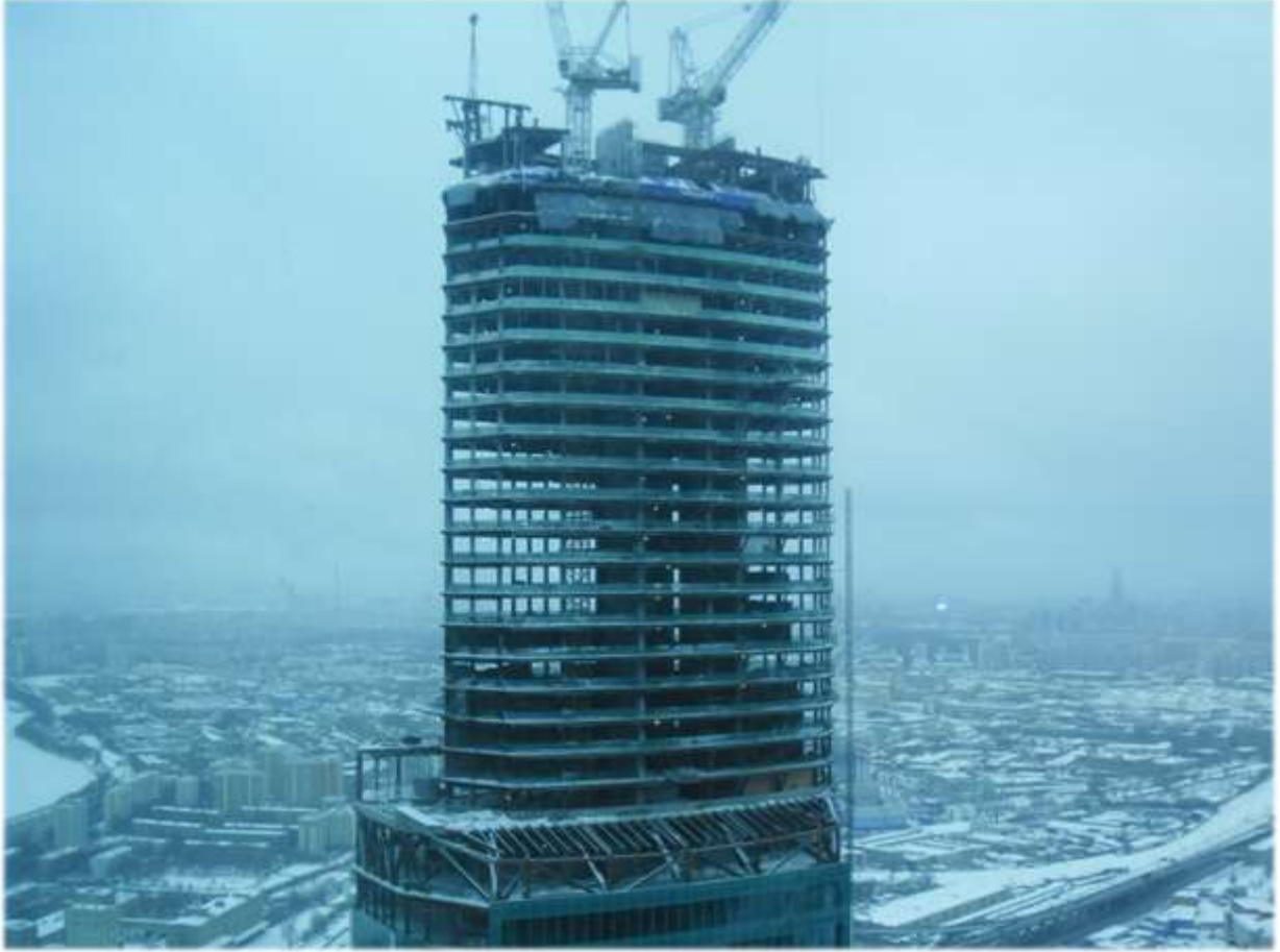
Plot 12 Çok Amaçlı İş Merkezi Projesi – Moskova, Rusya

sonu itibarıyla, betonarme ve çelik işlerinde %91 ilerleme sağlanmışken, elektro-mekanik ve mimari işlerde ilerleme %20 seviyesine ulaşmıştır. Toplam 1.120 çalışanı olan projenin, teslim tarihi Aralık 2013 olup, tüm çalışmalar bu yönde devam etmektedir.