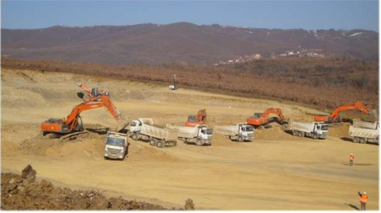
Morina-Merdare Otoyol Projesi - Kosova

Titaş, mevcut makine parkını daha da yenileyerek uzman kadrosuyla birlikte Morina-Merdare Otoyol Projesi'nin ilerleyen bölümlerinde ve başka projelerde, 2013 yılında da faaliyetlerini sürdürmeyi planlamaktadır.