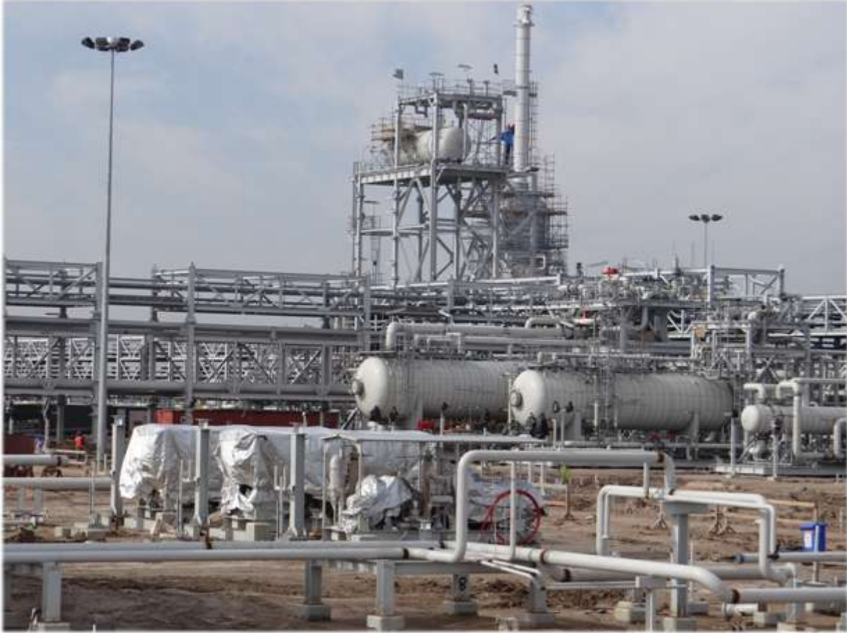
Mecnun Petrol Sahası - Irak

Mekanik, elektrik ve enstrümantasyon işlerine ek olarak, 2012 yılının Ağustos ayında, Enka, SIPD ile yeni bir kontrat imzalamış ve ilk ticari üretim etabı kapsamında olan, mevcut gazdan arındırma tesisi DS-2'nin rehabilitasyon işlerini de almıştır. Kontrat kapsamında Enka tarafından yapılacak mekanik, elektrik ve enstrümantasyon işleri ile tesisin günde 65 bin varile düşen kapasitesi, öncelikle orijinal tasarımı olan 100 bin varile ve sistemdeki darboğazların giderilmesi ile günde 120 bin varile çıkarılacaktır.