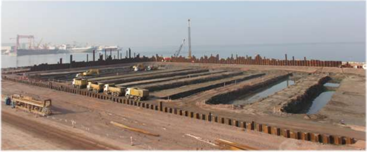
İzmit Körfez Geçişi Köprü Projesi, su jeti ile palplans ve çelik boru çakımı imalatı, Yalova - Türkiye

Kasktaş, geoteknik mühendisliği konusunda dünyadaki yeni teknolojileri ve uygulamaları yakından takip etmektedir. Bununla ilgili olarak Kasktaş, 2012 yılında, SBMA (tekil delgi çoklu ankraj) adı verilen ankraj kapasitelerini artırmaya yönelik yeni bir uygulamayı başarıyla gerçekleştirmiştir. 2012 yılında BSI tarafından gerçekleştirilen ISO 9001:2008 Kalite Yönetim Sistemi ile Çevre, İş Sağlığı ve Güvenliği Sistemleri'nin 3'üncü Şahıs Denetimi başarıyla tamamlanmıştır.