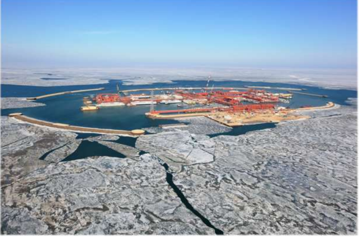
Açık Deniz İnşaat İşleri ve Yapay Adalar İnşa Projesi - Kazakistan

Kuzey Hazar Denizi'nin en sert tabiatında yer alan Kaşagan Bölgesi, dünya üzerinde son 30 yıl içerisinde keşfedilen en büyük petrol sahası olma özelliğine sahiptir. Bechtel-Enka ortaklığı, 1998 yılından beri Kaşagan Petrol Bölgesi'nin gelişimi kapsamında pekçok proje üstlenmiştir.