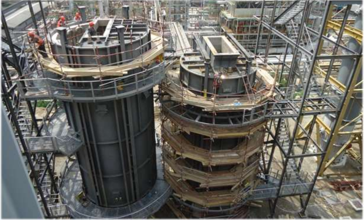
Habarovsk Rafinerisi Çelik ve Mekanik Montaj İşleri - Rusya

Enka, kontrat kapsamında, birleşik hidrokraking ve hidrotriting üniteleri (HDC ve HDT), hidrojen üretim ünitesi (HMU) ve opsiyonel olarak sahadışı bağlantı boru köprüleri ve borulaması işlerini yapacak olup, HDT, HDC ve HMU ünitelerinin mekanik montaj işleri, yeni ünitelere bağlantı mekanik montaj işleri, elektrik ve enstrüman montaj ve test işleri ile birlikte toplam kontrat bedeli 107 milyon ABD Doları mertebesine ulaşmıştır.