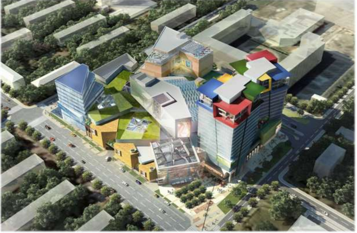
Kuntsevo Alışveriş Merkezi Dizaynı, Moskova-Rusya

Alışveriş merkezlerindeki mağazalar dışında, 2007 senesinde Vernadskovo kompleksi içindeki ofislerin kiraya verilmesi ile şirket ilk kez ofis kiralamaya da başlamıştır.