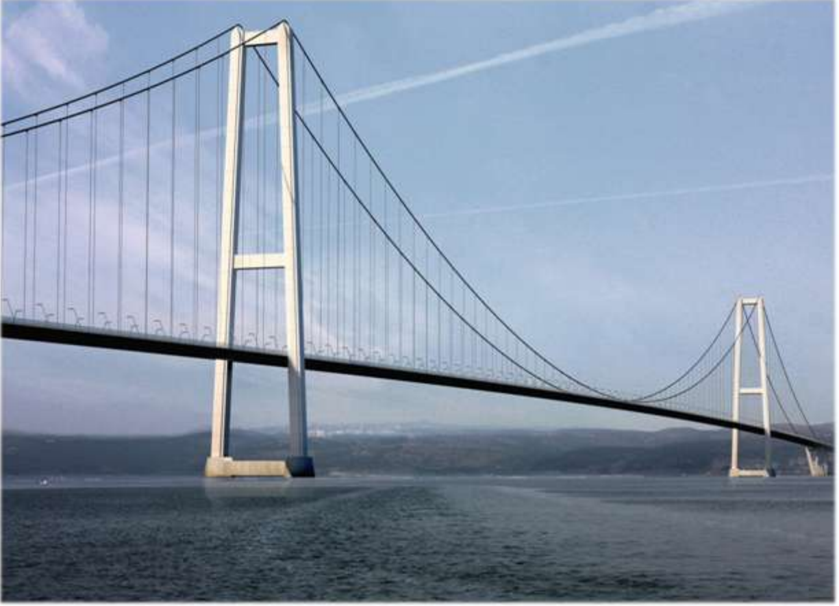
Izmit Körfez Geçişi Asma Köprü Projesi - 3D Canlandırma

Bechtel-Enka JV ile Çimtaş arasında imzalanmış olan ve Muskat Uluslararası Havaalanı (MC3) Projesi kapsamındaki muhtelif çelik yapıların detay mühendislik, üretim ve sahaya sevkini kapsayan sözleşme çerçevesinde, toplam 29 bin tonluk kapsamın 2012 yılı içerisinde 19 bin tonu imal edilerek sahaya sevk edilmiştir.