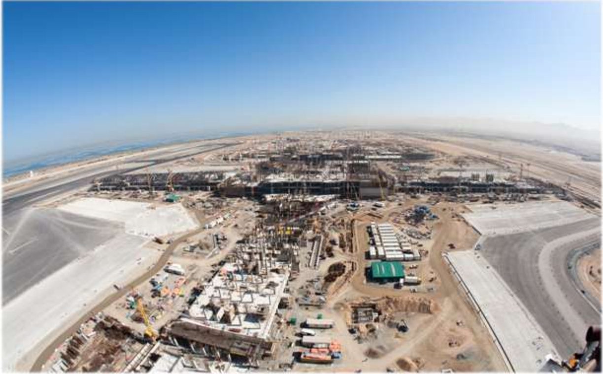
Maskat Uluslararası Havaalanı - Umman Sultanlığı

Kapalı bina alanı toplam brüt 647.480 metrekaredir. Projenin 38 ay içerisinde, 2014 yılı itibarıyla tamamlanması planlanmıştır. İş kapsamı yaklaşık 470 bin metreküp beton, 80 bin ton demir donatı, 4 milyon metreküp toprak işleri, 30 bin ton yapı çeliği, 135 bin metrekare cephe, 175 bin metrekare çatı, 225 bin metrekare blok, 600 bin metrekare yer ve 600 bin metrekare duvar kaplama işlerinden oluşmaktadır.