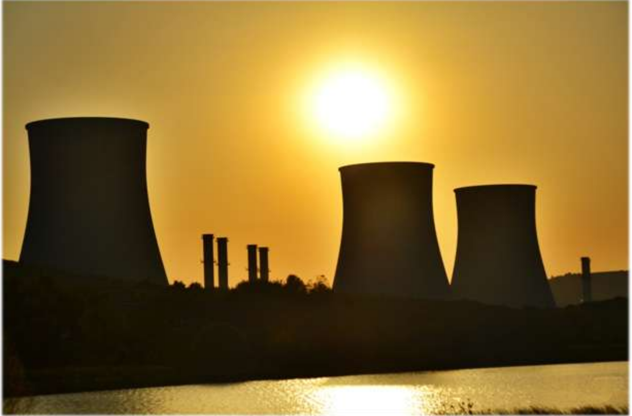
Adapazarı ve Gebze Doğalgaz Kombine Çevrim Santralleri - Türkiye

Gebze, Adapazarı ve İzmir doğalgaz kombine çevrim santrallerinin anahtar teslimi inşası Enka'nın %50 payının olduğu Bechtel-Enka Müşterek Teşebbüs Ortaklığı'na verilmiştir. 2000 yılında başlanan projelerden Gebze ve Adapazarı santralleri 2002 yılında, İzmir santrali ise 2003 yılında devreye alınmıştır. Santrallerin devreye girmesiyle Enka, ortağı InterGen ile birlikte Türkiye'nin en büyük özel sektör elektrik üreticisi konumuna gelmiştir.