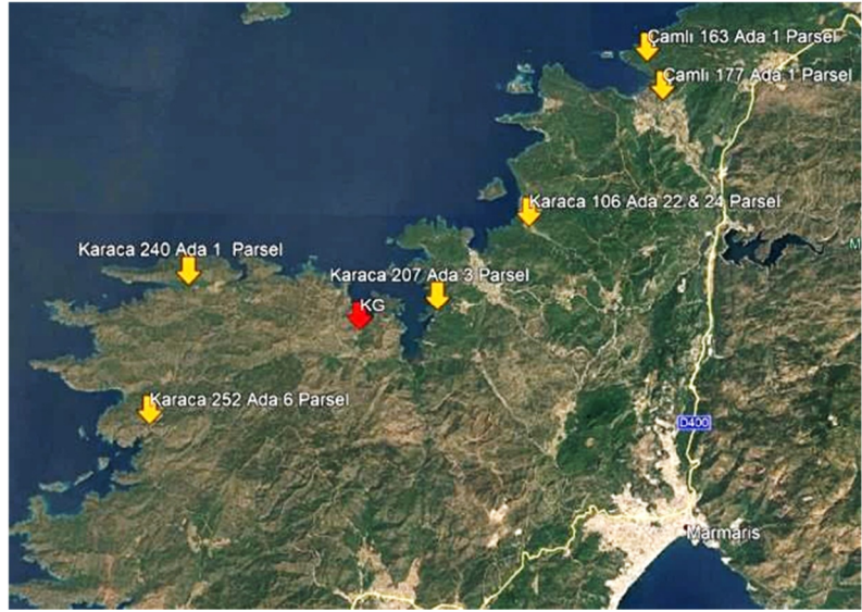
Tablo 11: Satılık Arazi Emsalleri

Pazar analizinde tespit edilen emsaller için istenen birim fiyat aralığının 108 - 413 TL/m 2 olduğu görülmüştür.