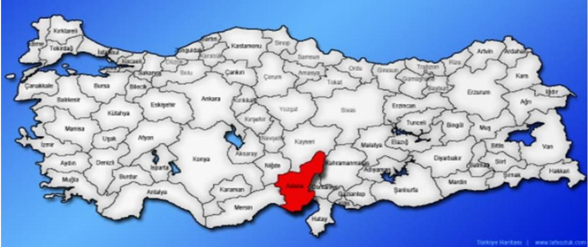
Harita 1 - Adana'nın Konumu

Akdeniz'de yaklaşık olarak 160 km kıyısı bulunan Adana, eski çağlardan beri Avrupa'yı Asya'ya bağlayan önemli ulaşım yolları üzerine kurulmuştur. Adana, Toros Dağlarının güneyinde yer alan Çukurova bölgesinde, Seyhan Nehri üzerine kurulmuş bir kenttir. İl merkezini kuzeyden güneye bölerek geçen Seyhan Nehri Akdeniz'e dökülür. Seyhan ve Ceyhan Nehirlerinin suladığı ovalar oldukça verimlidir. Bu özellikler nedeniyle geçmişten bugüne bir çok medeniyet bu bölgede yaşamıştır. Sahillerinde yer alan Karataş ve Yumurtalık ilçeleri antik kentler olması yanı sıra, bugün de ilin önemli tarih ve deniz turizm merkezleridir.