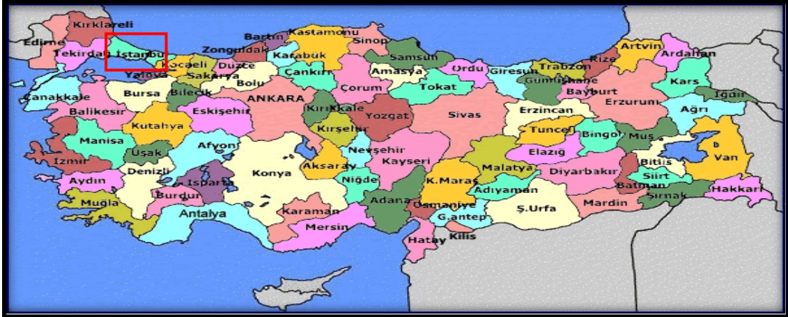
Harita 1 - İstanbul'un Konumu

İstanbul, Türkiye'nin en büyük kenti olup, 15 milyon kişiyi aşan nüfusu ile dünyanın da sayılı kentlerinden biri haline gelmiştir. Batı ile Doğu arasında köprü olma özelliği ile yerli ve yabancı sermaye için, bölgelerarası ilişki kurma ve bölgelere açılma yönünden önemli bir merkezdir. İstanbul Boğazı, Karadeniz'i, Marmara Denizi'yle birleştirirken; Asya Kıtası'yla Avrupa Kıtası'nı birbirinden ayırmakta ve İstanbul kentini de ikiye bölmektedir.