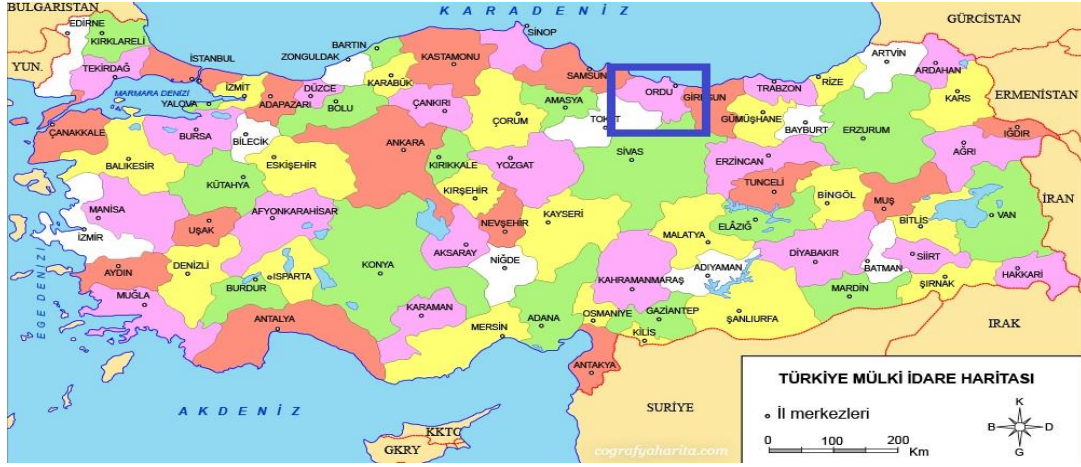
Harita 1 -Ordu İli'nin Konumu