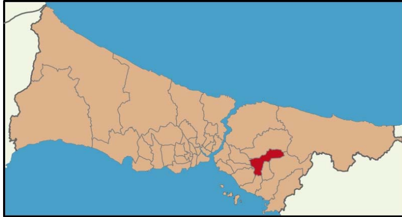
Harita 2 – Sancaktepe İlçesi Konumu

Havza niteliği taşıması nedeniyle son derece hassas bir yerleşim alanı olan bölge, Kurtköy Sabiha Gökçen Havalimanı'na olan bağlantıları, TEM Otoyolu ve TEM-Kartal bağlantı yolunun sağladığı ulaşım olanakları nedeniyle ulaşımı oldukça kolaydır. Sancaktepe İlçesi nüfus yoğunluğu bakımından, İstanbul ortalamasının üzerinde bir nüfus yoğunluğuna sahiptir.