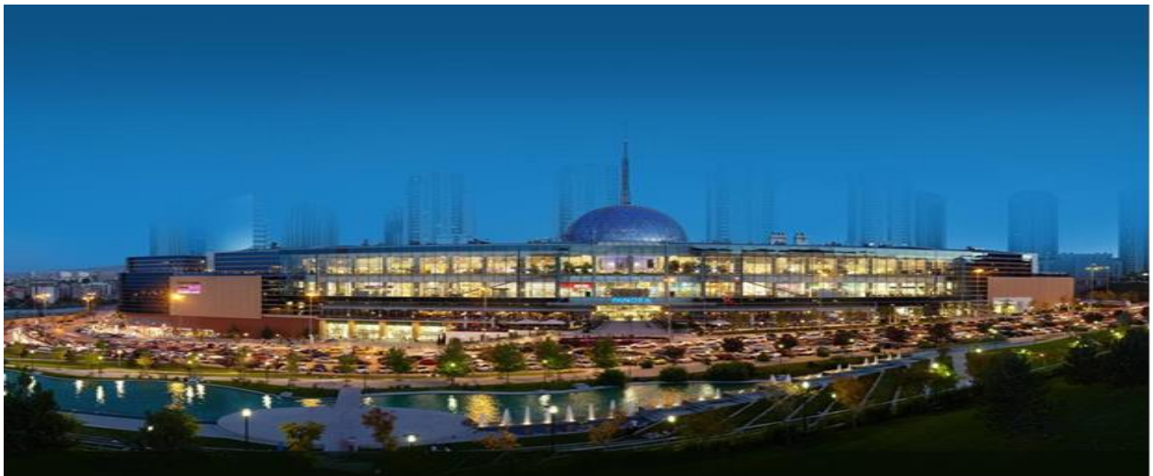
----- PANORA Alışveriş ve Yaşam Merkezi Oran/ANKARA -----

Şirketimiz portföyünde 2007 yılında tamamlanarak faaliyete geçen PANORA Alışveriş ve Yaşam Merkezi bulunmaktadır. Gayrimenkule ilişkin bilgi ve görseller aşağıda sunulmuştur.