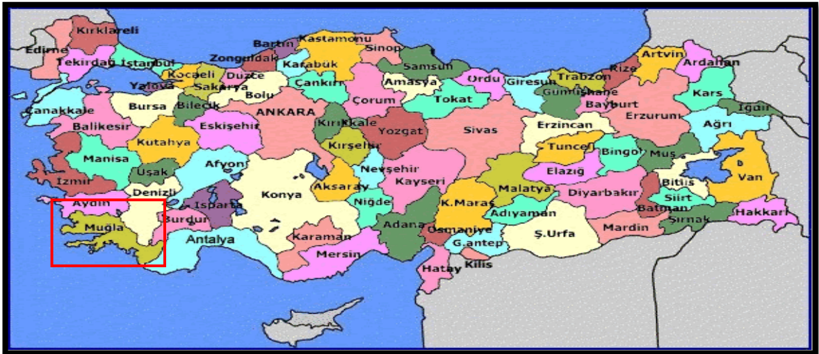
Harita 1 - Muğla'nın Konumu

Muğla denizden 670 m yükseklikte, üstü düz bir kaya kütlesi şekliyle ilginç bir görünüme sahip olan Asar Dağı'nın eteklerinde kurulmuştur. Muğla Ovası, Menteşe kalker platosunda Neojen çağında oluşmuş depresyonların sonradan karstlaşmasıyla oluşmuş çanak şeklindeki çukurluklardan biridir. Muğla ovasına benzer jeolojik yapıya sahip komşu ovalar Yeşilyurt, Ula, Gülağzı, Yerkesik, Akkaya, Çamköy, Yenice ovalarıdır. Muğla Ovası Karadağ, Kızıldağ, Asar dağı ve Hamursuz Dağı ile çevrelenmiştir. Düğerek'in kurulduğu yamaçların gerisinde rakım hızla artar ve Menteşe Dağları silsilesi içinde yer alan Yılanlı Dağı 2000 metreye ulaşır.