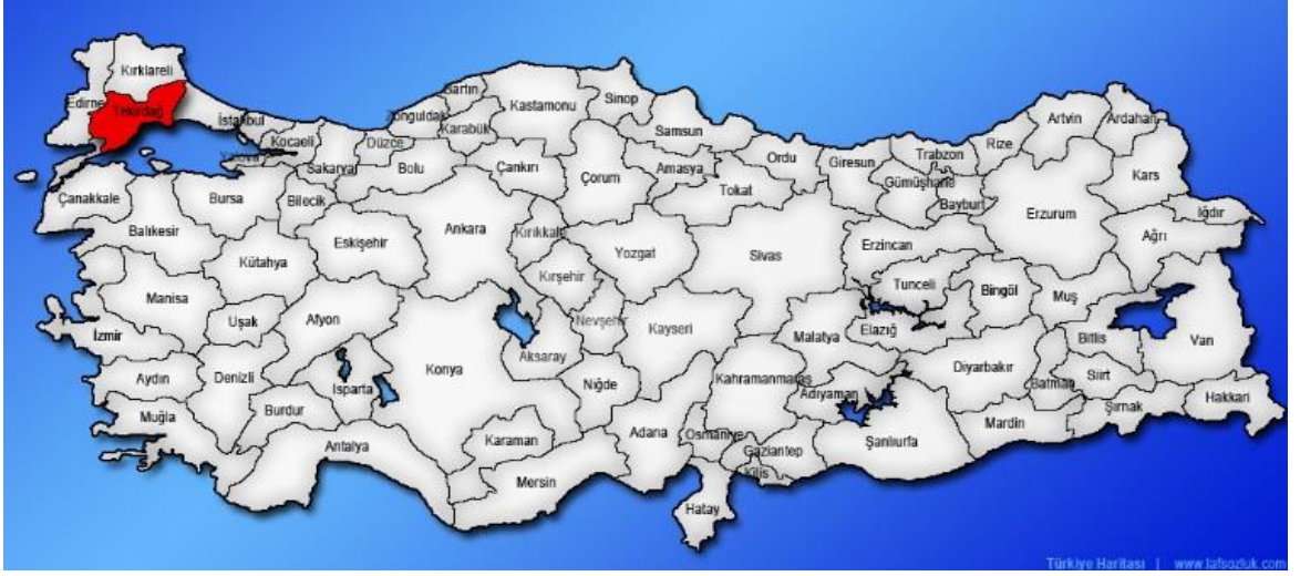
Harita 1 - Tekirdağ'ın Konumu

Marmara denizi ve Karadeniz'e kıyısı bulunan Tekirdağ ili; Türkiye'de iki denize kıyısı olan 6 ilden biridir. Marmara denizinin kuzeyinde ve tamamı Trakya topraklarında yer alan Tekirdağ; doğudan Silivri ve Çatalca ilçeleriyle, kuzeyden Kırklareli iline bağlı Vize, Lüleburgaz, Babaeski ve Pehlivan köy ilçeleriyle çevrili olup, Kuzeydoğudan Karadeniz'e 1.5 km'lik bir kıyısı bulunmaktadır.