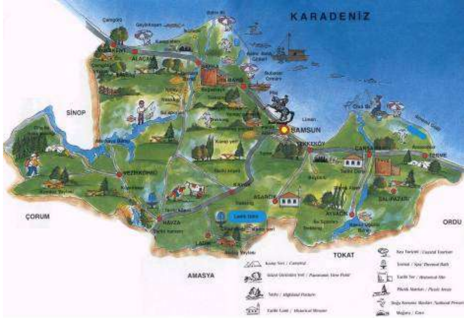
Şekil 1. Samsun Haritası

metaller, bakır, makine, tütün, kâğıt ve kâğıt ürünleri, kimya sanayi ve oto yedek parça sanayi olarak sıralanmaktadır.