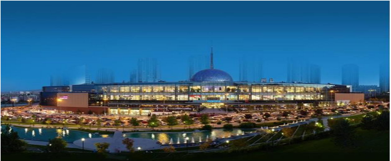
----- PANORA Alışveriş ve Yaşam Merkezi Oran/ANKARA -----

Şirketimiz portföyünde 2007 yılında tamamlanarak faaliyete geçen PANORA Alışveriş ve Yaşam Merkezi bulunmaktadır. Gayrimenkule ilişkin bilgi ve görseller aşağıda sunulmuştur.