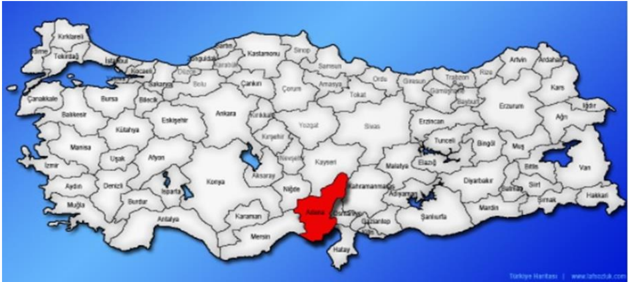
Harita 1 - Adana'nın Konumu

Akdeniz'de yaklaşık olarak 160 km kıyısı bulunan Adana, eski çağlardan beri Avrupa'yı Asya'ya bağlayan önemli ulaşım yolları üzerine kurulmuştur. Adana, Toros Dağlarının güneyinde yer alan Çukurova bölgesinde, Seyhan Nehri üzerine kurulmuş bir kenttir. İl merkezini kuzeyden güneye bölerek geçen Seyhan Nehri Akdeniz'e dökülür. Seyhan ve Ceyhan Nehirlerinin suladığı ovalar oldukça verimlidir. Bu özellikler nedeniyle geçmişten bugüne bir çok medeniyet bu bölgede yaşamıştır. Sahillerinde yer alan Karataş ve Yumurtalık ilçeleri antik kentler olması yanı sıra, bugün de ilin önemli tarih ve deniz turizm merkezleridir.