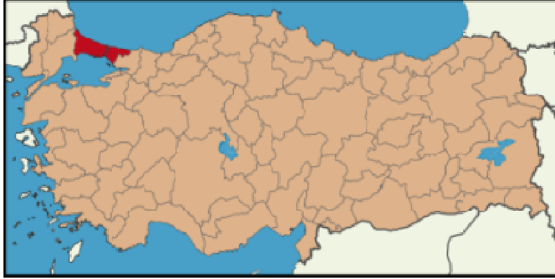
Harita 1 - İstanbul İli Konumu

Ülkenin finans merkezi olan İstanbul'un nüfusu 13 milyonun üzerinde olup, bu rakam artmaya devam etmektedir. Adrese Dayalı nüfus Kayıt Sistemi verilerine göre İstanbul İli'nin 2012 yılı toplam nüfusu 13.854.740 kişi olup ülke nüfusu içerisinde %18'lik orana sahiptir. İkinci en büyük şehir olan Ankara'dan yaklaşık üç kat fazla nüfusa sahip olan şehir, ülkenin kentleşme sürecinin de ana odağı olmuştur. Konut ihtiyacının en belirgin olduğu şehir olan İstanbul yeterli ve kaliteli konut temininde ciddi sorunlar yaşamaktadır. Sonuç olarak, kent dışında devlet ve özel yatırımcılar tarafından yeni toplu konutlar yapılmakta, şehrin Avrupa Yakası'nda gelişme şehir merkezinin batısından bu kent dışı alanlara doğru kaymaktadır.