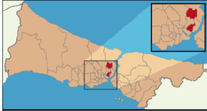
Harita 2 – Şişli İlçesi Konumu

İstanbul'un merkezinde yer alan Şişli güneyinde Beyoğlu, doğusunda Beşiktaş, kuzeyinde ve batısında Kağıthane ilçeleri ile çevrilidir. Şişli çok çeşitlilik gösteren bir bölge olup, her sınıftan ofis binasını, yeni karma projeleri, alışveriş merkezlerini, konut bölgelerini, beş yıldızlı otelleri ve konferans merkezlerini bünyesinde barındırmaktadır. İlçe kuzeyde Mecidiyeköy ve Zincirlikuyu üzerinden Ayazağa'yı da içine alarak Sarıyer'e, kuzeybatıda ise Hürriyet-i Ebediye Tepesi üzerinden Kağıthane'ye kadar geniş bir alana yayılır. Adrese Dayalı Nüfus Kayıt Sistemi verilerine göre ilçenin 2012 yılı nüfusu 318.217 kişidir ve toplam yüzölçümü 30 km 2 olan ilçe idari olarak 28 mahalleden oluşmaktadır.