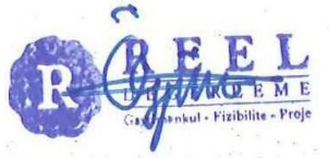
A. Özgün HERGÜL Lisans No: 402487