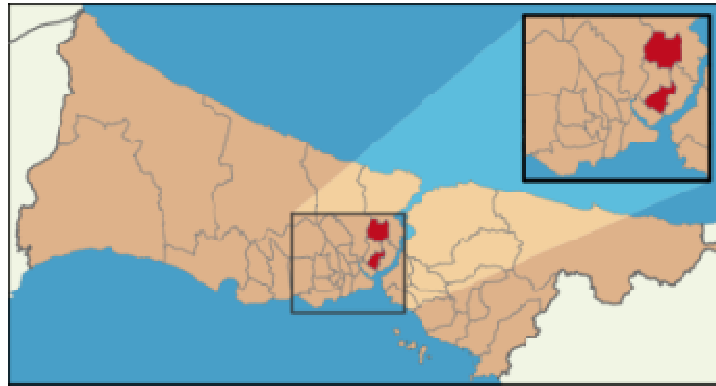
Harita 2 – Şişli İlçesi Konumu

İstanbul'un merkezinde yer alan Şişli güneyinde Beyoğlu, doğusunda Beşiktaş, kuzeyinde ve batısında Kağıthane ilçeleri ile çevrilidir. Şişli çok çeşitlilik gösteren bir bölge olup, her sınıftan ofis binasını, yeni karma projeleri, alışveriş merkezlerini, konut bölgelerini, beş yıldızlı otelleri ve konferans merkezlerini bünyesinde barındırmaktadır. İlçe kuzeyde Mecidiyeköy ve Zincirlikuyu üzerinden Ayazağa'yı da içine alarak Sarıyer'e, kuzeybatıda ise Hürriyet-i Ebediye Tepesi üzerinden Kağıthane'ye kadar geniş bir alana yayılır. Adrese Dayalı Nüfus Kayıt Sistemi verilerine göre ilçenin 2012 yılı nüfusu 318.217 kişidir ve toplam yüzölçümü 30 km 2 olan ilçe idari olarak 28 mahalleden oluşmaktadır.