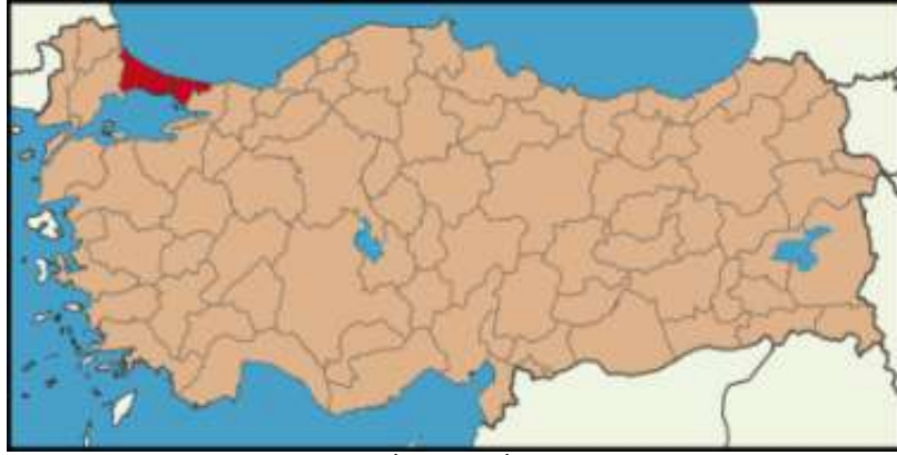
Harita 1 - İstanbul İli Konumu

Ülkenin finans merkezi olan İstanbul'un nüfusu 13 milyonun üzerinde olup, bu rakam artmaya devam etmektedir. Adrese Dayalı nüfus Kayıt Sistemi verilerine göre İstanbul İli'nin 2012 yılı toplam nüfusu 13.854.740 kişi olup ülke nüfusu içerisinde %18'lik orana sahiptir. İkinci en büyük şehir olan Ankara'dan yaklaşık üç kat fazla nüfusa sahip olan şehir, ülkenin kentleşme sürecinin de ana odağı olmuştur. Konut ihtiyacının en belirgin olduğu şehir olan İstanbul yeterli ve kaliteli konut temininde ciddi sorunlar yaşamaktadır. Sonuç olarak, kent dışında devlet ve özel yatırımcılar tarafından yeni toplu konutlar yapılmakta, şehrin Avrupa Yakası'nda gelişme şehir merkezinin batısından bu kent dışı alanlara doğru kaymaktadır.