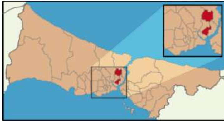
Harita 2 – Şişli İlçesi Konumu

İstanbul'un merkezinde yer alan Şişli güneyinde Beyoğlu, doğusunda Beşiktaş, kuzeyinde ve batısında Kağıthane ilçeleri ile çevrilidir. Şişli çok çeşitlilik gösteren bir bölge olup, her sınıftan ofis binasını, yeni karma projeleri, alışveriş merkezlerini, konut bölgelerini, beş yıldızlı otelleri ve konferans merkezlerini bünyesinde barındırmaktadır. İlçe kuzeyde Mecidiyeköy ve Zincirlikuyu üzerinden Ayazağa'yı da içine alarak Sarıyer'e, kuzeybatıda ise Hürriyet-i Ebediye Tepesi üzerinden Kağıthane'ye kadar geniş bir alana yayılır. Adrese Dayalı Nüfus Kayıt Sistemi verilerine göre ilçenin 2012 yılı nüfusu 318.217 kişidir ve toplam yüzölçümü 30 km 2 olan ilçe idari olarak 28 mahalleden oluşmaktadır.