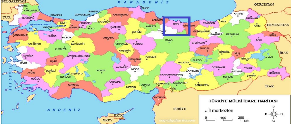
Harita 1 -Ordu İli'nin Konumu

Tuik 2017 verilerin göre Ordu ili nüfusu 742.341 kişidir. Bunların 371.061 kişi erkek, 371.280 kişi, kadın nüfusu olarak belirtilmiştir.