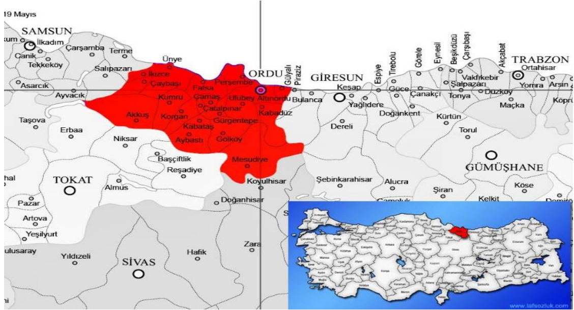
Harita 2 - Ordu'nun İlçelerinin Konumları