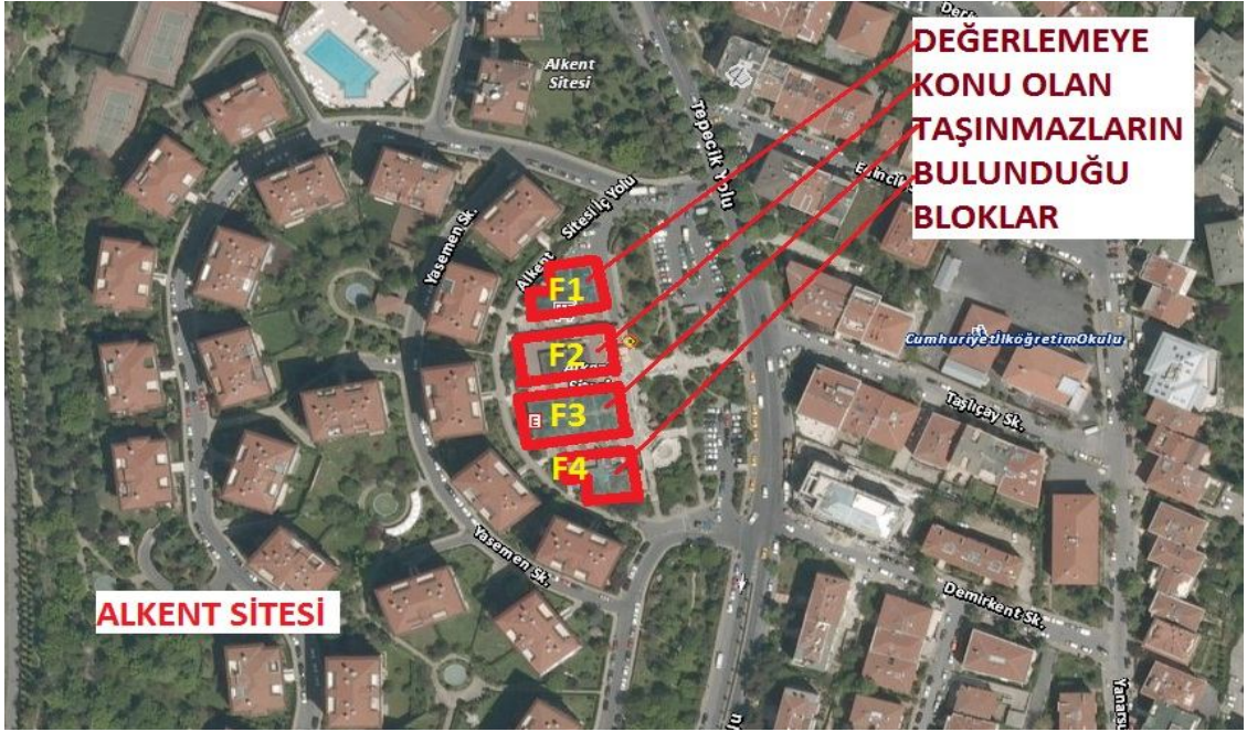
Harita 4 - Taşınmazların Bulunduğu Blokların Konumu