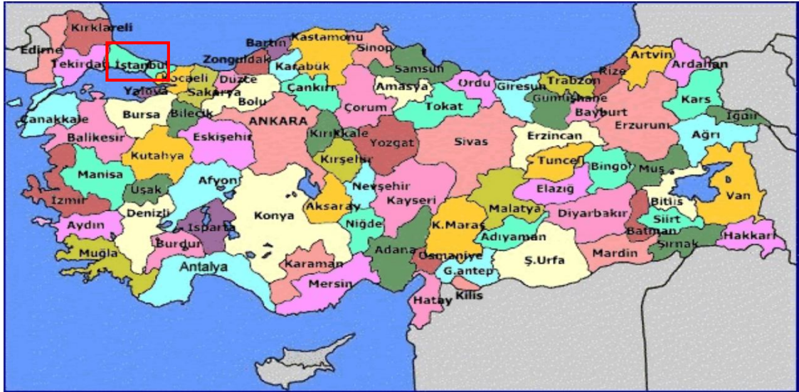
Harita 7- İstanbul'un Konumu

İstanbul, Türkiye'nin en büyük kenti olup, 13 milyon kişiyi aşan nüfusu ile dünyanın da sayılı kentlerinden biri haline gelmiştir. Batı ile Doğu arasında köprü olma özelliği ile yerli ve yabancı sermaye için, bölgelerarası ilişki kurma ve bölgelere açılma yönünden önemli bir merkezdir. İstanbul Boğazı, Karadeniz'i, Marmara Denizi'yle birleştirirken; Asya Kıtası'yla Avrupa Kıtası'nı birbirinden ayırmakta ve İstanbul kentini de ikiye bölmektedir.