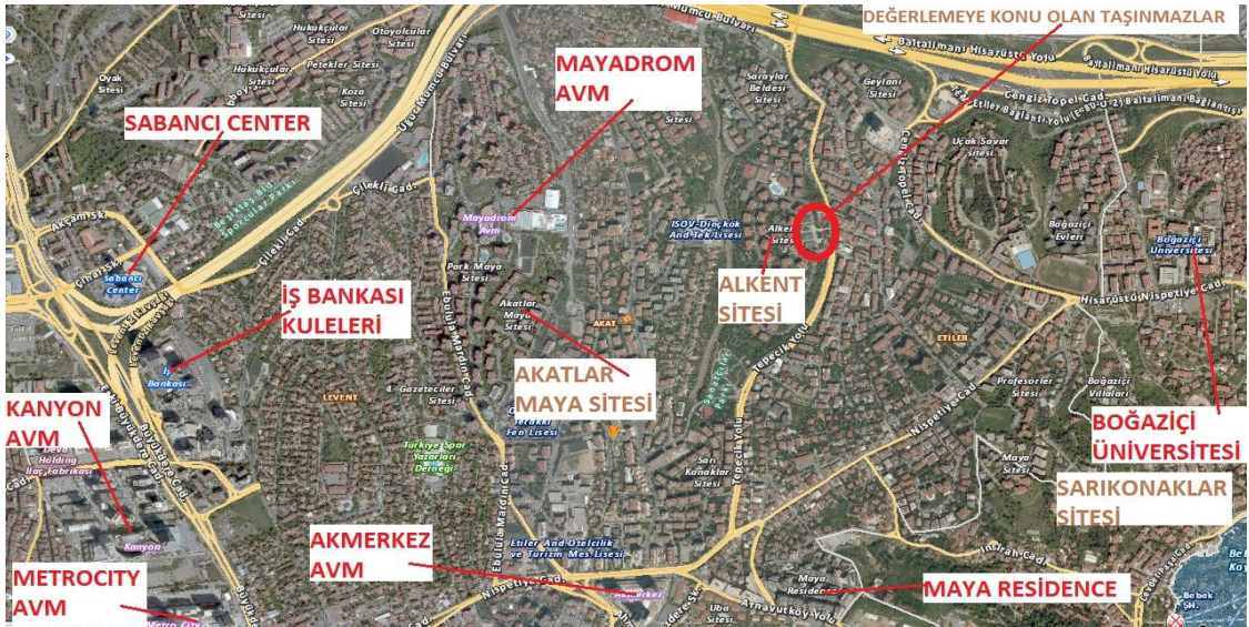
Harita 3 - Taşınmazların Konumu

Akmerkezin en önemli ticari birim olduğu bölgede İş Kuleleri, Kanyon, Metrocity, inşaa sürecindeki Zorlu AVM en önemli perakende ticari merkezleridir. Alkent Alış-Veriş Merkezi bu önemli ticari merkezlerinin tamamlayıcısı nieliğinde olan bir bir merkezdir. Özellikle günlük ticari birimlerin yer seçtiği bir merkezdir.