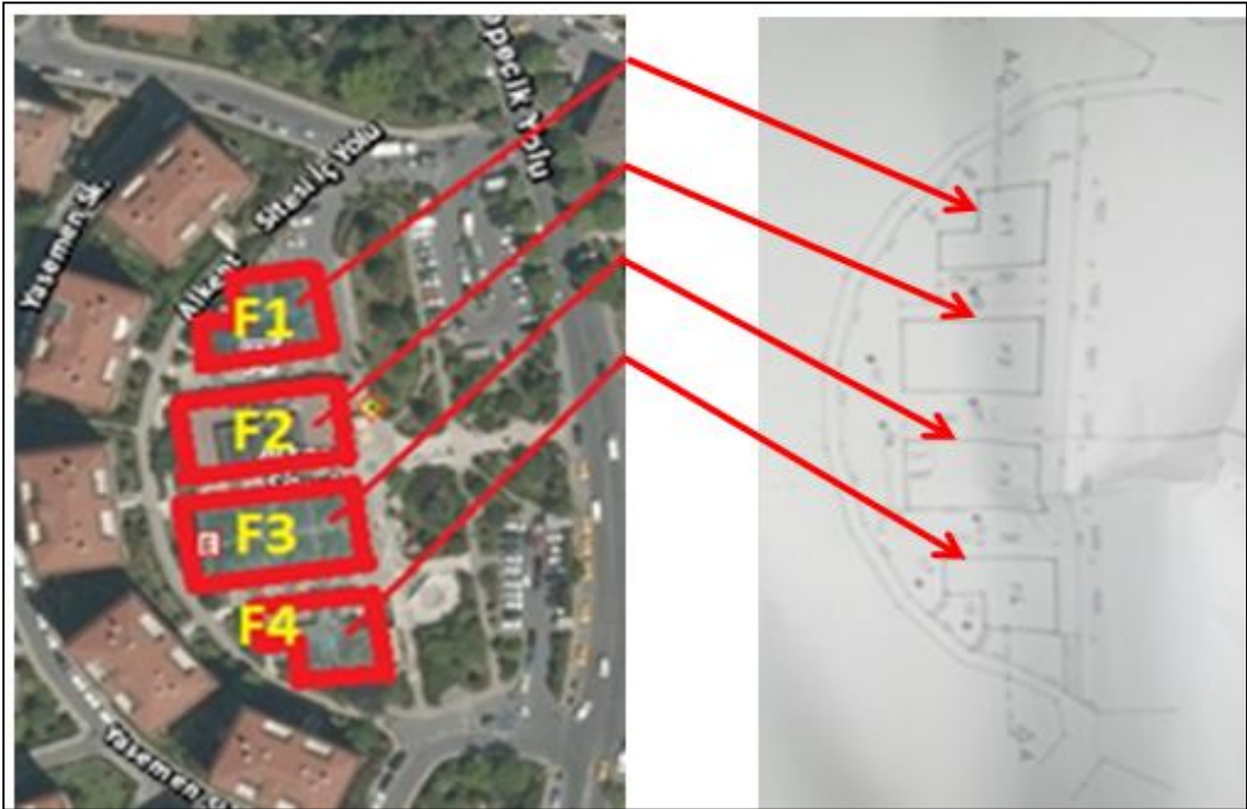
Harita 1 - Taşınmazların Konumu

Değerlemeye konu olan taşınmazlar; İstanbul İli, Beşiktaş İlçesi, Akatlar Mahallesi, Tepecik Caddesi üzerinde yer alan Etiler Alkent Sitesi, Alkent Alış-Veriş Merkezi'nde yer alan F1 Bloкта yer alan 1,2,3 bağımsız bölüm numaralı asma katlı dükkanlar, F2 Bloкта yer alan 1,2,3,4,5,6,7,8,11,12,13,14,15,16 bağımsız bölüm numaralı asma katlı dükkanlar, F3 blokta yer alan 1,2,3,4,5,6,7,8,9,10,11,12 bağımsız bölüm numaralı asma katlı dükkanlar, F4 blokta yer alan 1,2,3,4,5,6,7,8,9,10 bağımsız bölüm numaralı asma katlı dükkanlardır.