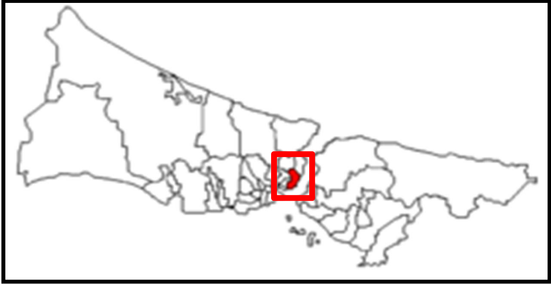
Harita 8- İstanbul'un Konumu