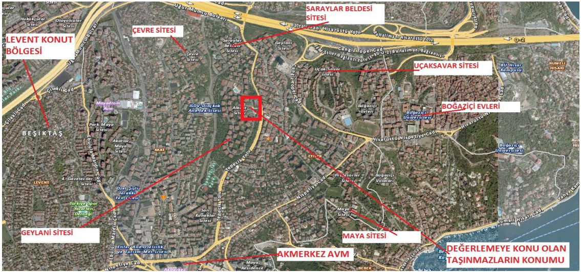
Harita 2 - Taşınmazların Konumu

Akmerkezin en önemli ticari birim olduğu bölgede İş Kuleleri, Kanyon, Metrocity, inşaa sürecindeki Zorlu AVM en önemli perakende ticari merkezleridir. Alkent Alış-Veriş Merkezi bu önemli ticari merkezlerinin tamamlayıcısı nieliğinde olan bir bir merkezdir. Özellikle günlük ticari birimlerin yer seçtiği bir merkezdir.