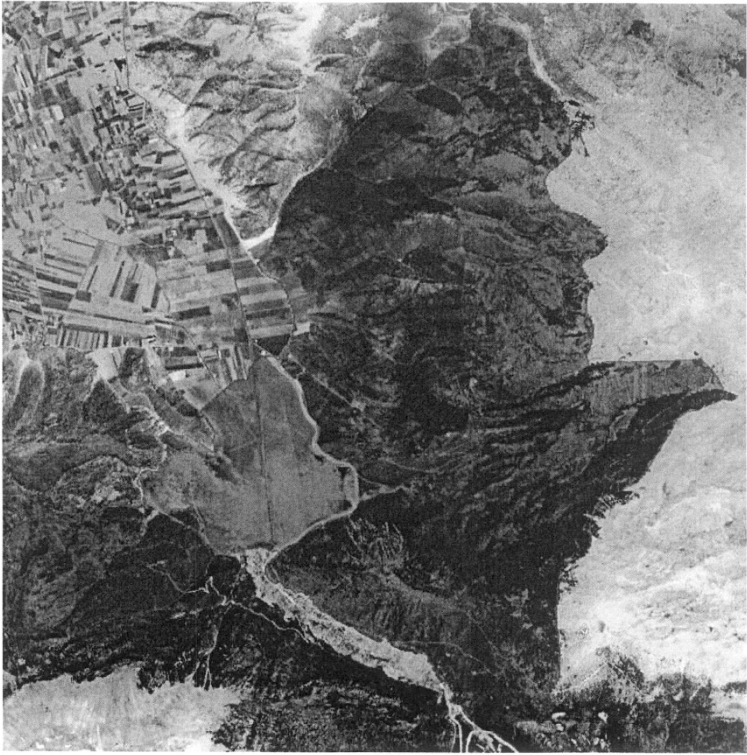
Dođal Sit-Nitelikli Dođal Koruma Alanı