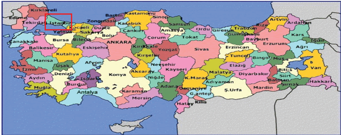
Harita 1 - İstanbul'un Konumu

İstanbul, Türkiye'nin en büyük kenti olup, 13 milyon kişiyi aşan nüfusu ile dünyanın da sayılı kentlerinden biri haline gelmiştir. Batı ile Doğu arasında köprü olma özelliği ile yerli ve yabancı sermaye için, bölgelerarası ilişki kurma ve bölgelere açılma yönünden önemli bir merkezdir. İstanbul Boğazı, Karadeniz'i, Marmara Denizi'yle birleştirirken; Asya Kıtası'yla Avrupa Kıtası'nı birbirinden ayırmakta ve İstanbul kentini de ikiye bölmektedir.