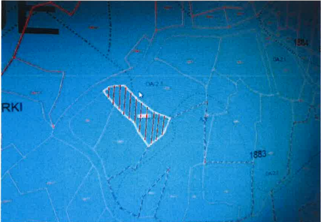
İmar Plan Örneği

Ayrıca bölge Gümüşsuyu Proje Alanı'nda kaldığından bu alanda 6292 sayılı Orman Köylülerinin Kalkınmalarının Desteklenmesi ve Hazine Adına Orman Sınırları Dışına Çıkarılan Yerlerin Değerlendirilmesi İle Hazineye Ait Tarım Arazilerinin Satışı Hakkında Kanunu'nun 8. Maddesine göre uygulama yapılacaktır.