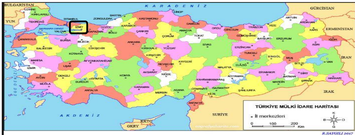
Harita 1 -Kocaeli'nin Konumu

Kocaeli'nin İlçeleri: Körfez, Kandıra, Gebze, Çayırova, Darıca, Derince Dilovası, Başiskele ve merkez ilçe İzmittir.