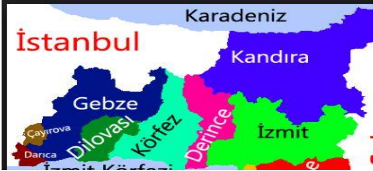
Harita 2 - Kocaeli'nin İlçelerinin Konumları

Çanakkale ilinin ekonomisi tarıma dayanır. Sanâyi yeni yeni gelişmektedir. Turizm, balıkçılık ve ormancılığın ekonomideki yeri giderek artmaktadır. İmâlât sanâyi gelişmektedir. Balık, üzüm ve seramik meşhurdur.