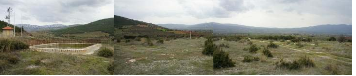
226 NUMARALI PARSEL