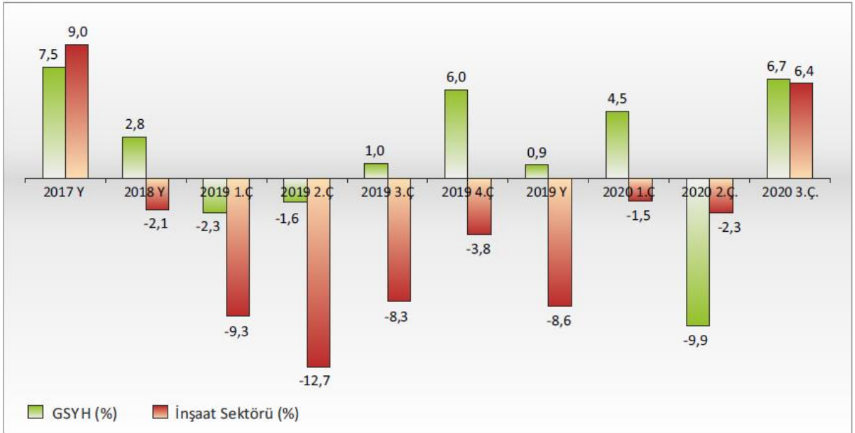
GSYH ve İnşaat Sektöründe Büyümenin Seyri (% puan)

TÜİK'in Ekim 2020 dönemi verilerine göre; ülkede istihdam edilen kişi sayısı inşaat sektöründe artmış (110 bin), tarım, sanayi ve hizmetler sektörlerinde ise gerilemiştir. Sektörde, özellikle geçen yıl daralan istihdam hacminde yeniden artış olmuş ve istihdam edilen kişi sayısı 1,7 milyonu aşmıştır. Bu rakamlarla ekonomide istihdam edilenlerin %6,4'ü inşaat sektöründe yer almıştır. 2020 yılı başında bu oran 1,4 milyon kişiyle %5,2 olarak açıklanmıştır.