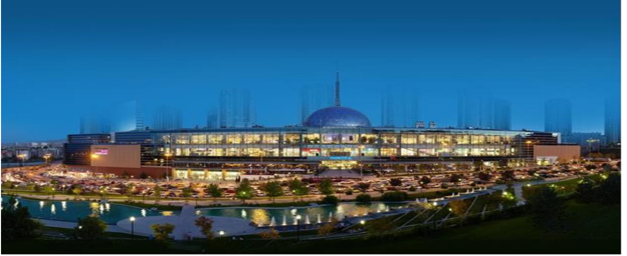
----- PANORA Alışveriş ve Yaşam Merkezi Oran-Çankaya/ANKARA -----

Şirketimiz portföyünde tek gayrimenkul olarak 2007 yılında tamamlanarak faaliyete geçen PANORA Alışveriş ve Yaşam Merkezi bulunmaktadır. Gayrimenkule ilişkin bilgi ve görseller aşağıda sunulmuştur.