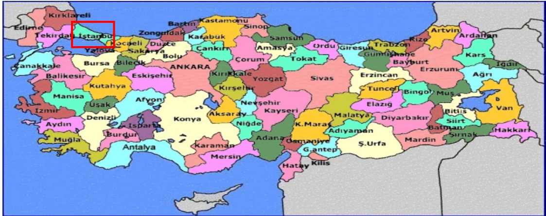
Harita 5 - İstanbul'un Konumu

İstanbul, Türkiye'nin en büyük kenti olup, 13 milyon kişiyi aşan nüfusu ile dünyanın da sayılı kentlerinden biri haline gelmiştir. Batı ile Doğu arasında köprü olma özelliği ile yerli ve yabancı sermaye için, bölgelerarası ilişki kurma ve bölgelere açılma yönünden önemli bir merkezdir. İstanbul Boğazı, Karadeniz'i, Marmara Denizi'yle birleştirirken; Asya Kıtası'yla Avrupa Kıtası'nı birbirinden ayırmakta ve İstanbul kentini de ikiye bölmektedir.