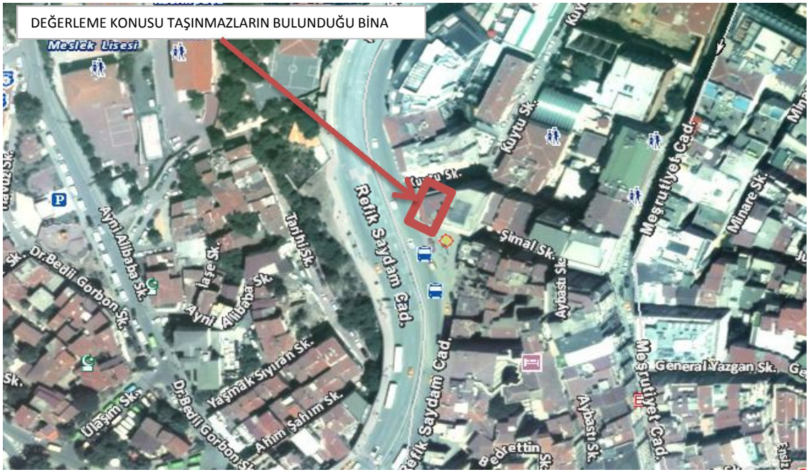
Harita 3 - Taşınmazın Konumu