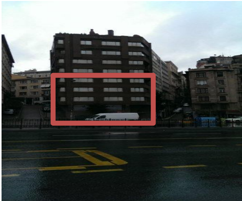
Harita 1 - Taşınmazın Konumu

Beyoğlu İlçe Belediyesi, Denizpalas, Pera Palas Oteli, The Marmara Oteli yakın çevredeki nirengi noktalarıdır. Çevredeki yapıların restorasyonu devam etmektedir. İngiliz Konsoloslugu, Eski ABD Büyükelçiliği, Beyoğlu Teknik ve Endüstri Meslek Lisesi, Ticaret Anadolu Meslek Lisesi, Ticaret Odası Terzi Meslek Lisesi, Öğretmen Evi yakın çevredeki birimlerdir. Bölgede Tarlabası Bulvarı'na İstiklal Caddesi ve Tünel ile Galata Kulesi'ne yakın konumu, bölgedeki boş arsaların azlığı, tarihi doku karakteristikleri ve tarihi binaların yoğunluğu özellikle son yıllarda çok sayıda otel, restoran, kafe ve turizme dönük ticaret biriminin açılmasına ve bölgenin değişim sürecine girmesine neden olmuştur.