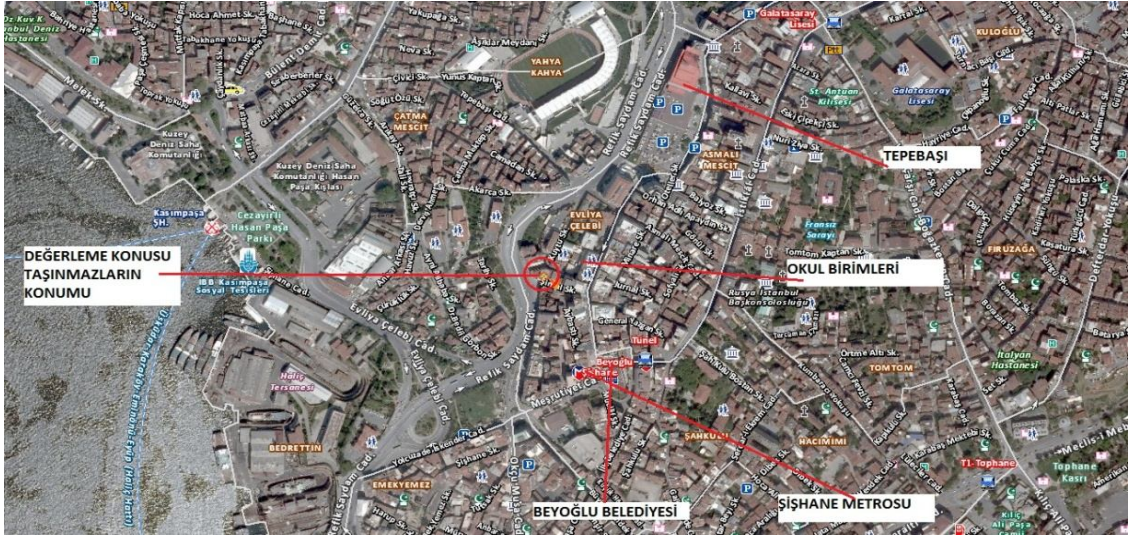
Harita 2 - Taşınmazın Konumu