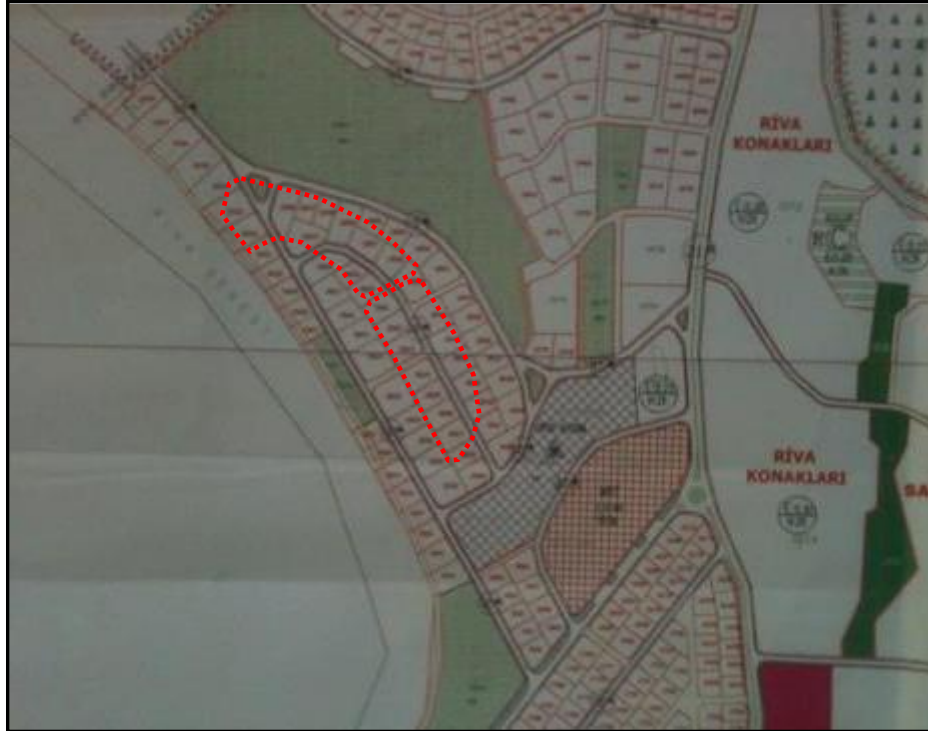
Parsellerin Konumlu Olduğu Yapı Adaları