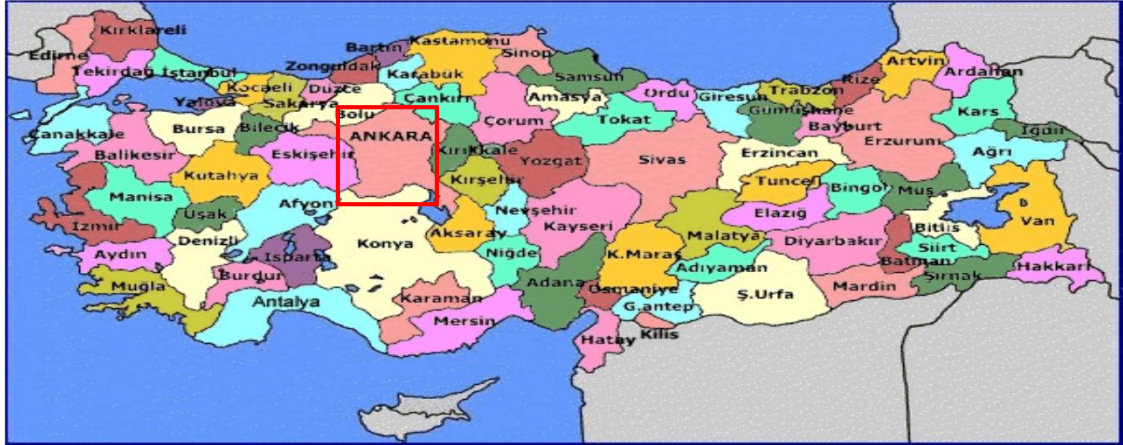
Harita 1 - Ankara'nın Konumu

Ankara, başkent olmadan önce otuz bin kişilik bir nüfusa sahipti; ancak başkent olduktan sonra önce İstanbul ve İzmir'den sonra en kalabalık üçüncü kent oldu, ardından İzmir'i geçerek İstanbul'dan sonra Türkiye'nin en kalabalık kenti oldu. Ankara bugün dünyanın en kalabalık 38. kentidir. Kent nüfusu bugün beş milyon civarında olmakla birlikte her geçen gün büyümektedir. Kent, ülkenin en çok göç alan kentlerindedir.