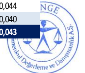
Tablo 8: Emsal Denkleştirme Tablosu