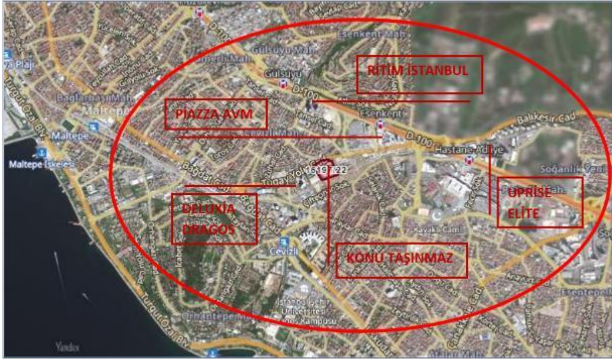
Görsel 3: Emsal Haritası