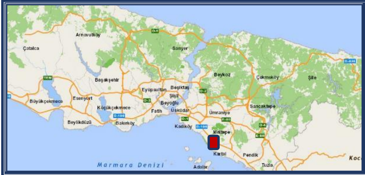
Harita 1: Mülkün İstanbul ölçeğindeki konumu

Çalışmaya konu olan gayrimenkul ulaşım açısından oldukça avantajlı konumdadır. İstanbul ölçeğinde bakıldığında merkezi bir konumda oldukları görülmektedir. D100 Karayolu ve Sahilyolu bağlantı yolları ve kavşaklara olan yakınlığı ulaşım açısından avantajlı bir konumda olduğunun göstergesidir. Konu gayrimenkuller G22-a-09-d-1-c pafta, 16197 ada, 22 parsel olan erişim doğrudan Tugay Yolu Caddesi'nden sağlanmaktadır.