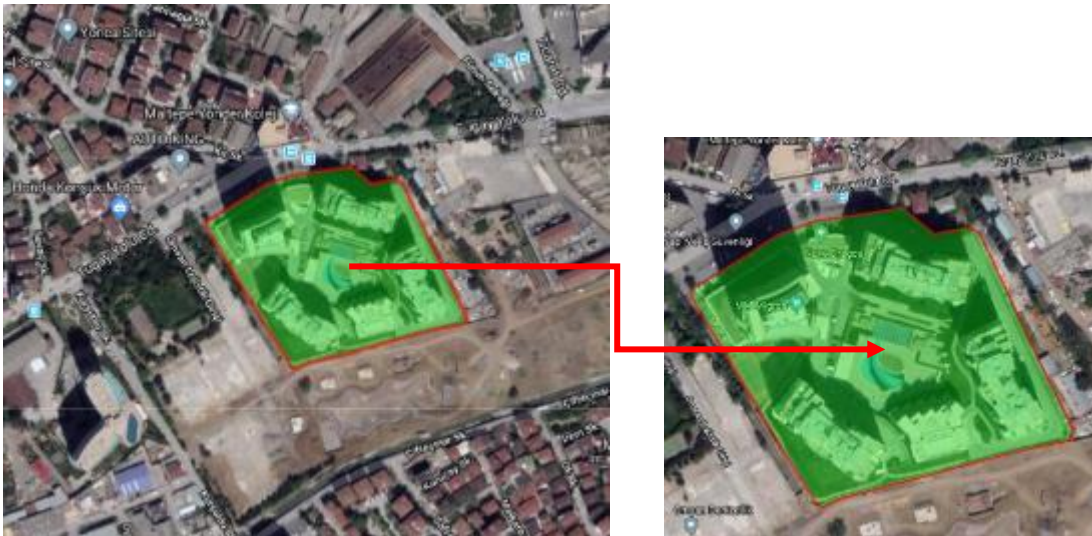
Harita 3: Ana Gayrimenkul ve Yakın Çevresi