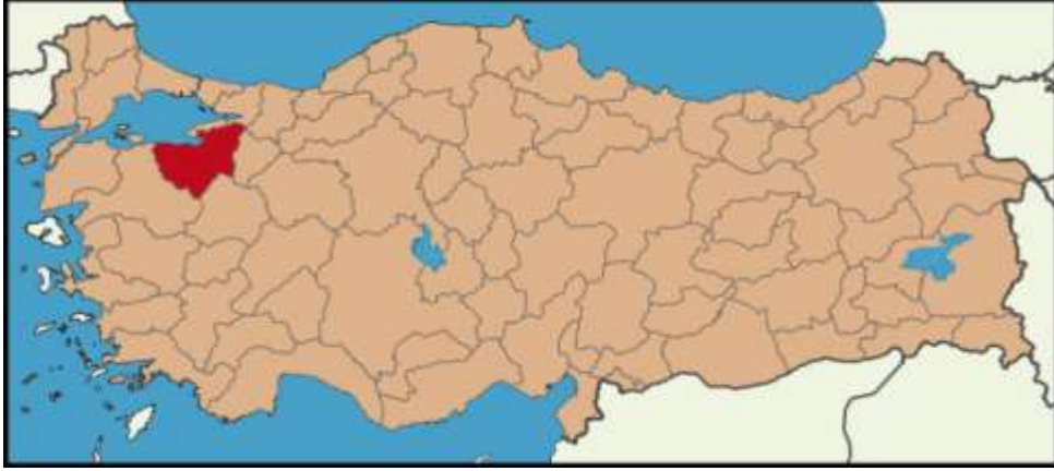
Harita 1 - Bursa İli Konumu

Bursa, Marmara Bölgesi'nin Güney Marmara bölümünde yer almakta olup, 1.036 km 2 yüzölçümü ile Türkiye'nin 4. Büyük kentidir. Bursa İli; kuzeyinde Marmara Denizi ve Yalova, kuzeydoğuda Kocaeli ve Sakarya, doğuda Bilecik, güneyde Kütahya ve Balıkesir illeri ile çevrilidir. Bursa Şehri; Uludağ'ın yamaçları boyunca kurulmuş ve kuzey-kuzeybatı aksı boyunca gelişmiştir. Deprem Araştırma Merkezi tarafından hazırlanan Türkiye Deprem Haritası'na göre, Marmara çevresinde aktif fayların bulunması nedeniyle, Bursa 1. derece deprem kuşağı içerisinde yer almaktadır. Adrese Dayalı Nüfus Kayıt Sistemi'ne göre, Bursa İli'nin 2012 yılı nüfusu 2.688.171'dir.