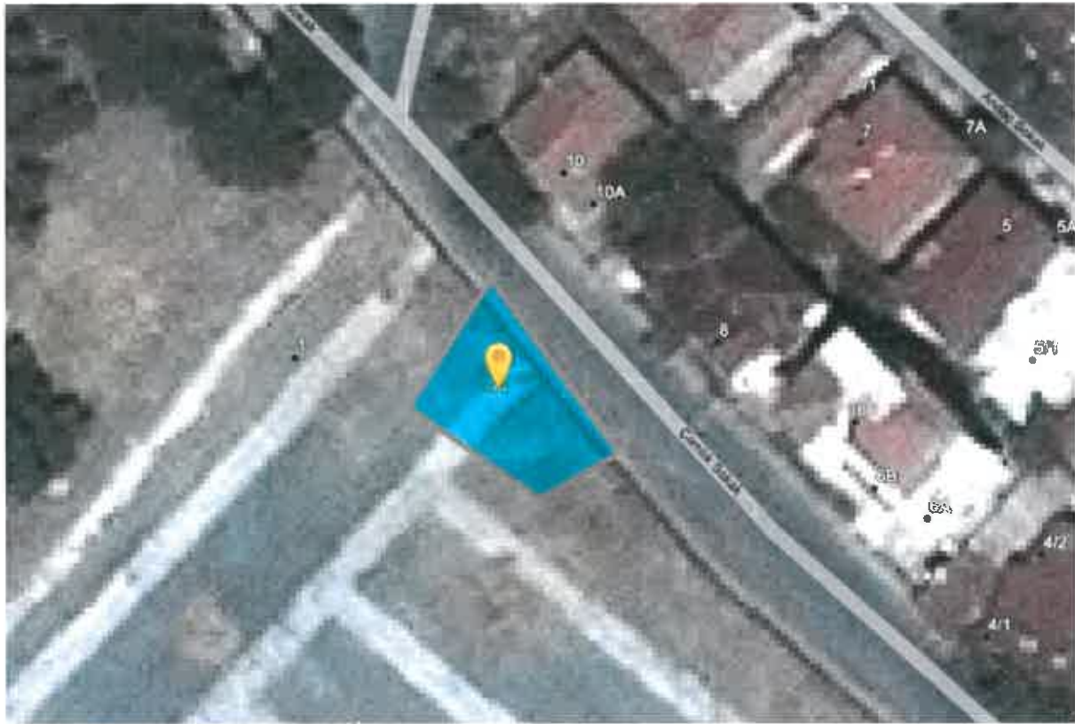
10050 ada 395 parsel