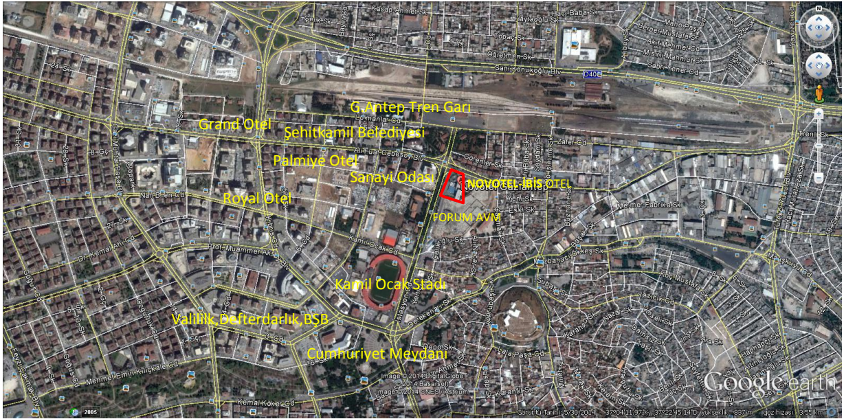
Değerleme Konusu Gayrimenkulün (Novotel ve İbis Otel) Konumu

Değerleme konusu otellere toplu taşıma ve özel araçlar ile rahatlıkla ulaşım sağlanabilmektedir.