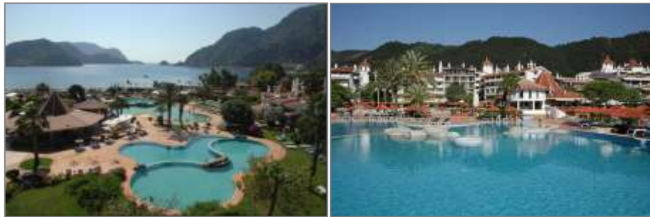
Martı Resort Deluxe Otel, İçmeler

Martı Resort Deluxe Otel , İçmeler Koyu'nda 31.134 m 2 alan üzerine kurulu, Marmaris Merkez'e 7 km. mesafede yer alan 5 yıldızlı bir tesistir. 1969 yılında kurulmuş olan 279 odalı otel, 560 yatak kapasitesine sahiptir. Otelde 2 adet açık havuz, fitness merkezi, SPA ve sağlık merkezi, Türk hamamı, sauna, dalış okulu, tenis kortu, kapalı havuz ve özel plaj alanı bulunmaktadır.