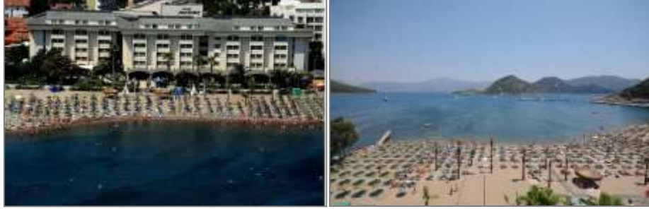
Munamar Beach Hotel, İmeler

Munamar Beach Hotel , İmeler Koyun'da, Marmaris Merkez'e 8 km. mesafede yer alan 5 yıldıızlı bir tesistir. 180 odalı otelde, aık havuz, fitness merkezi, Trk hamamı, sauna, masaj, su sporları, dalıř okulu ve zel plaj alanı bulunmaktadır. Tesis Mayıs-Kasım ayları arasında her řey dahil konseptiyle hizmet vermektedir.