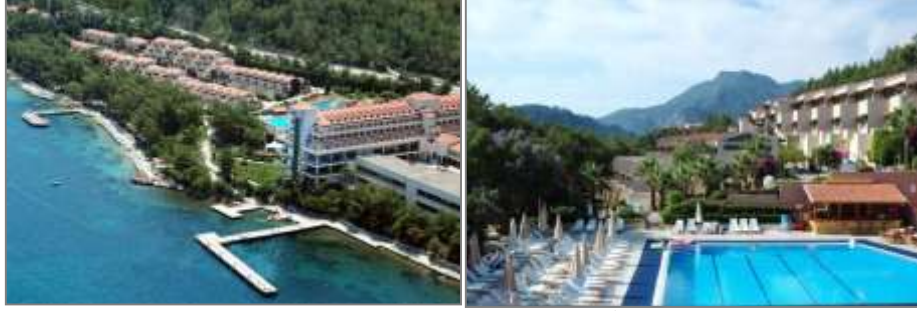
Grand Yazıcı Mares Otel, Pamucak/İçmeler

Grand Yazıcı Mares Otel , İçmeler Pamucuk Mevkii'nde, Marmaris Merkez'e 4 km. mesafede yer alan 5 yıldızlı bir tesistir. Ana otel binası ve iki-üç katlı villalardan oluşan tesiste, 271 adet standart oda, 10 adet suit oda ve 159 adet villada 440 yatak kapasitesine sahiptir. Marmaris Koyu'na bakan tesisin özel plaj alanı mevcuttur. Otelde açık havuz, fitness merkezi, SPA ve sağlık merkezi, Türk hamamı, sauna, dalgıç okulu, tenis kortu, basketbol ve futbol sahaları, su sporları ve özel plaj alanı bulunmaktadır. Tesis Mayıs-Kasım ayları arasında her şey dahil konseptiyle hizmet vermektedir.