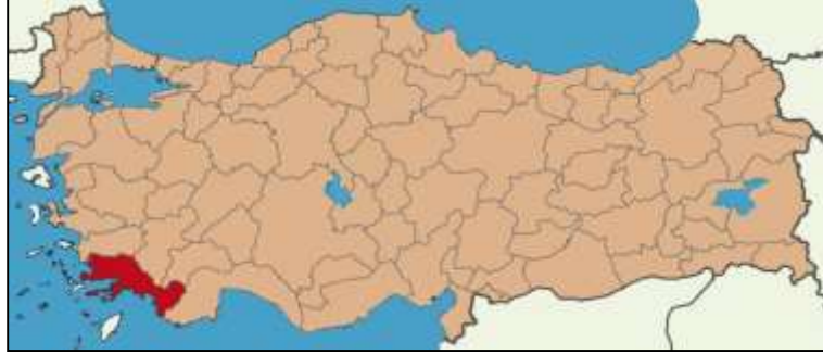
Harita-1 Muğla İli'nin Konumu ve ilçeleri

Türkiye'nin Ege Bölgesi'nde yer alan Muğla İli; kuzeyinde Aydın, kuzeydoğusunda Denizli ve Burdur, doğusunda Antalya İlleri ve güneybatısında Ege Denizi, güneydoğusunda ise Akdeniz ile sınırlanmaktadır. 13.338 km 2 büyüklüğünde alana sahip olan ilde toplam 12 ilçe (Muğla Merkez dışında; Bodrum, Dalaman, Datça, Fethiye, Kavaklıdere, Köyceğiz, Marmaris, Milas, Ortaca, Ula, Yatağan) bulunmaktadır. Uzunluğu yaklaşık 1.100 km. olan denize cephesiyle Muğla ülkenin en uzun sahil şeridinde sahip ilidir. Muğla'nın ADNKS 2012 yılı verilerine göre nüfusu 851.145 kişi olarak açıklanmıştır.