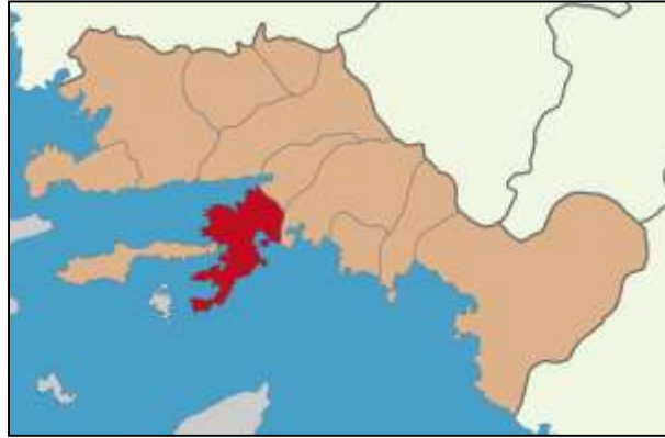
Harita-1 Marmaris İlçesi'nin Konumu ve ilçeleri

Genel ekonomisi tarım, hayvancılık, turizm ve tekne yapımına bağlı olan ilçede çok sayıda otel, motel, pansiyon, apart otel ve tatil köyü bulunmaktadır. İlçe'ye ulaşım deniz ve karayolu dışında, 90 km. uzaklıkta ki Dalaman Havaalanı üzerinden de sağlanabilmektedir.