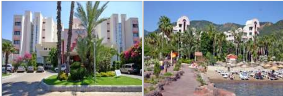
Hotel Aqua, İçmeler

Hotel Aqua , İçmeler Koyu'nda, 9.500 m 2 alan üzerine kurulu, Marmaris Merkez'e 7,5 km. mesafede yer alan 5 yıldızlı bir tesistir. 240 odalı otel, 480 yatak kapasitesine sahiptir. Otelde açık ve kapalı havuz, fitness merkezi, Türk hamamı, sauna, SPA ve masaj merkezi ile özel plaj alanı bulunmaktadır. Tesis Mayıs-Kasım ayları arasında her şey dahil konseptiyle hizmet vermektedir.