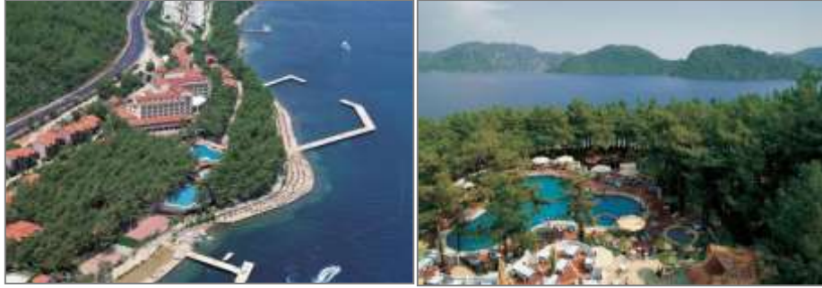
Grand Yazıcı Marmaris Palace, Pamucak/İçmeler

Grand Yazıcı Marmaris Palace , İçmeler Pamucuk Mevkii'nde, 70.000 m 2 alan üzerine kurulu, Marmaris Merkez'e 4 km. mesafede yer alan 5 yıldızlı bir tesistir. 459 odalı otel, 918 yatak kapasitesine sahiptir. Marmaris Koyu'na bakan tesisin özel plaj alanı mevcuttur. Otelde açık havuz, fitness merkezi, SPA ve masaj merkezi, tenis kortu, su sporları, basketbol, mini futbol, buz pateni, mini golf, Türk hamamı ve sauna bulunmaktadır. Tesis Mayıs-Kasım ayları arasında her şey dahil konseptiyle hizmet vermektedir.